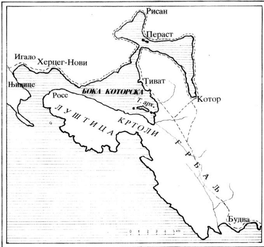
Савремени називи градова и мјеста који су споменути у тексту