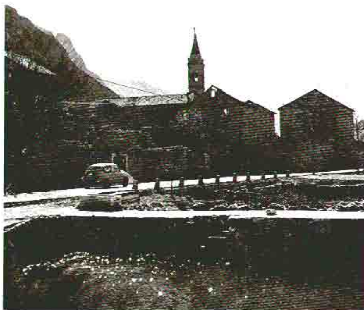
Sl. 3. Motiv iz naselja Marovci u Dobron.

U ovim starim naseljima ima znatan broj polupomišanih i oštećenih kuća, pa bi trebalo davati prednost obnovi tih zdanja pred gradnjom novih. Izgradnja, pak, novih objekata trebala bi biti strogo uvjetovana da se ne naruše postignute arhitektonske, urbanističke i pejzažne vrijednosti.