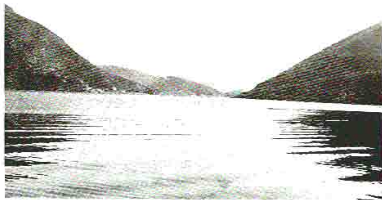
Sl. 1 Pogled kroz tjesnicu Verige prema prednjem dijelu Boke Kotorske. Morska ravnina s obje strane brda prekrivena spontanim vegetacijom i uokvireno nebo