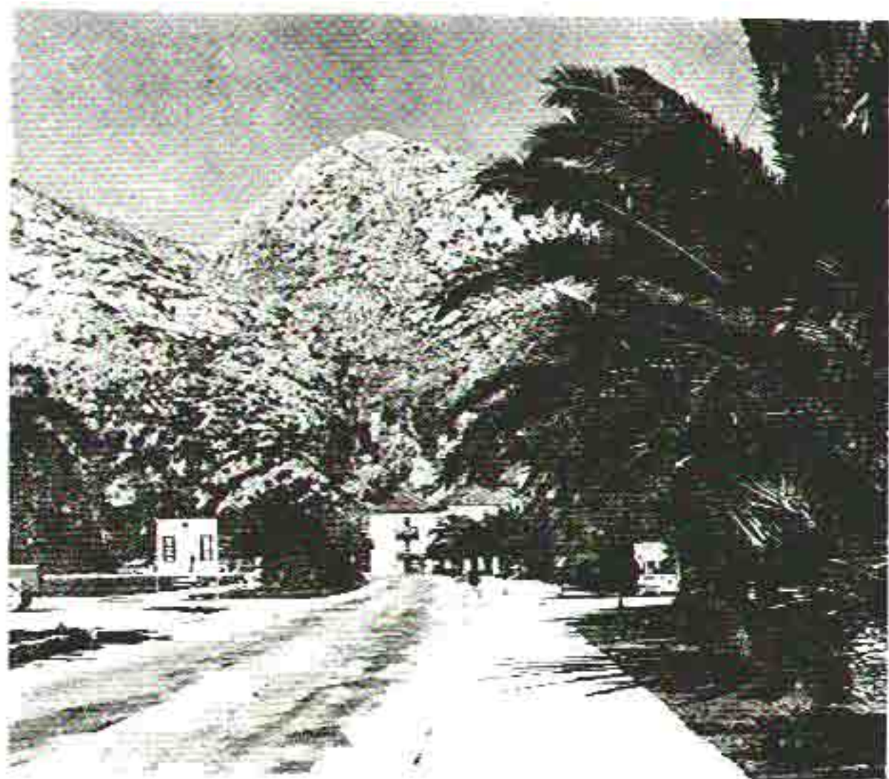
Sl. 4. Oljale u Risuu.

Ova statila palmi dobro uspijevaju, no ne mogu se mimoći pitanje: doprinose li autentičnom pejzažnom ugodaju?