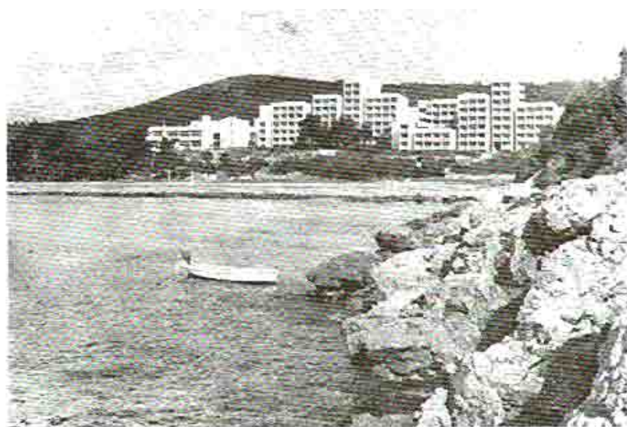
Plaža Pržno sa hotelom «Plavi horizonti»