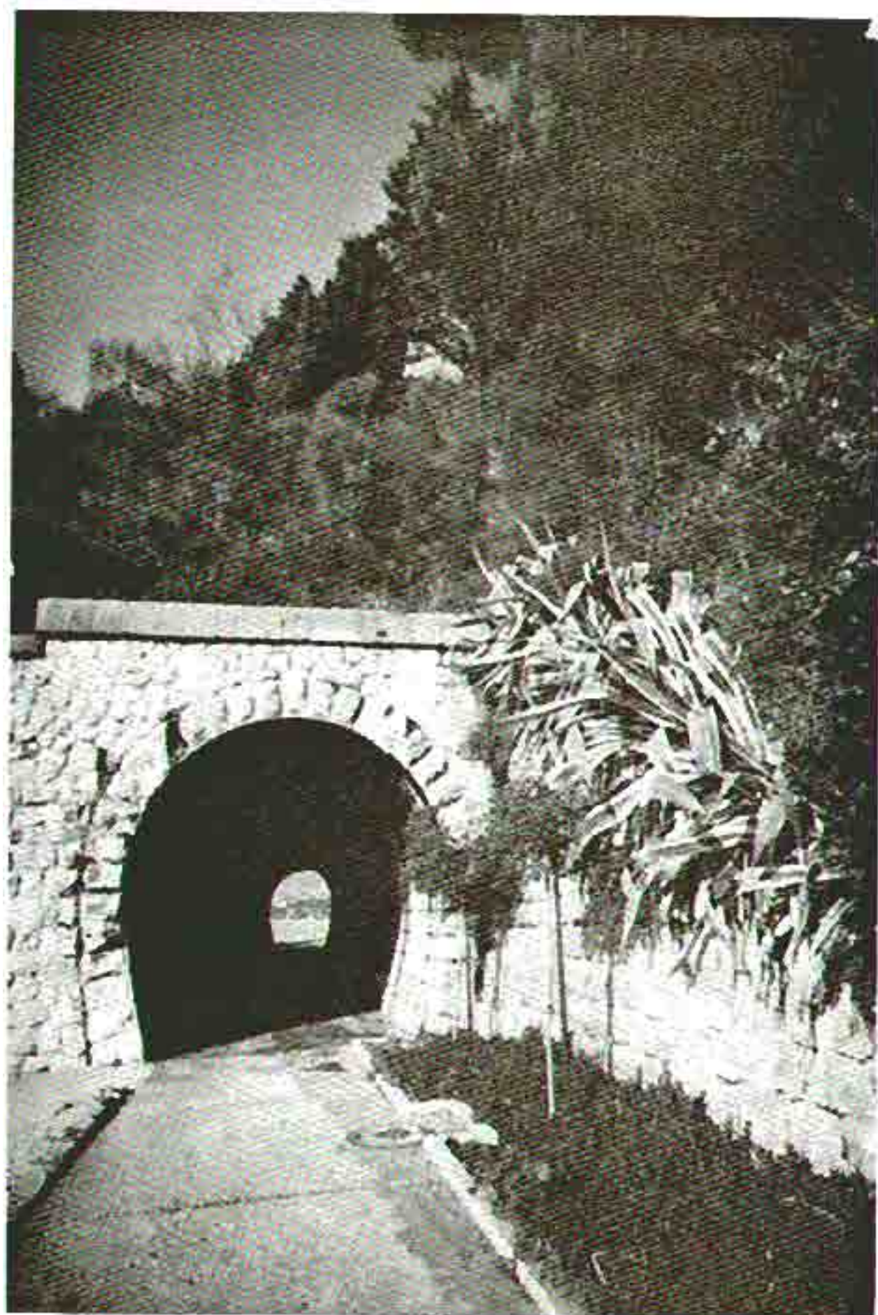
Slika 4. Detalj nefunkcionatnog zelenila na setalistu kraj mora u Herceg-Novom