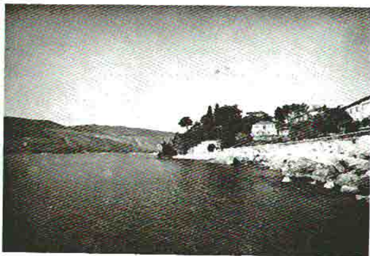
Slika 3. Jedan od najživopisnijih detalja kraj mora u Herceg-Novom