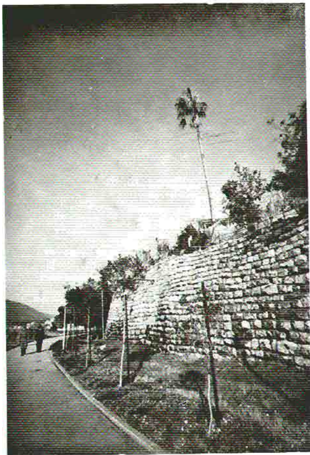
Slika 2. Detalj setajista kraj mora u Herceg-Novom sa nefunkcionalnim drvočedom