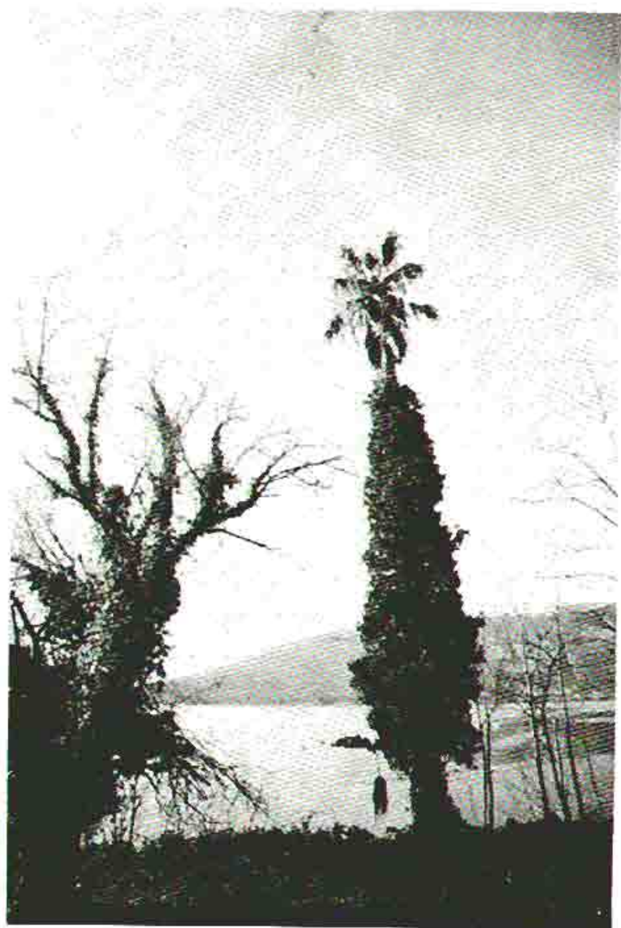
Slika 5. Stabla oštećena pužavicama zbog neprimjenjivanja mera negovanja u Herceg-Novom