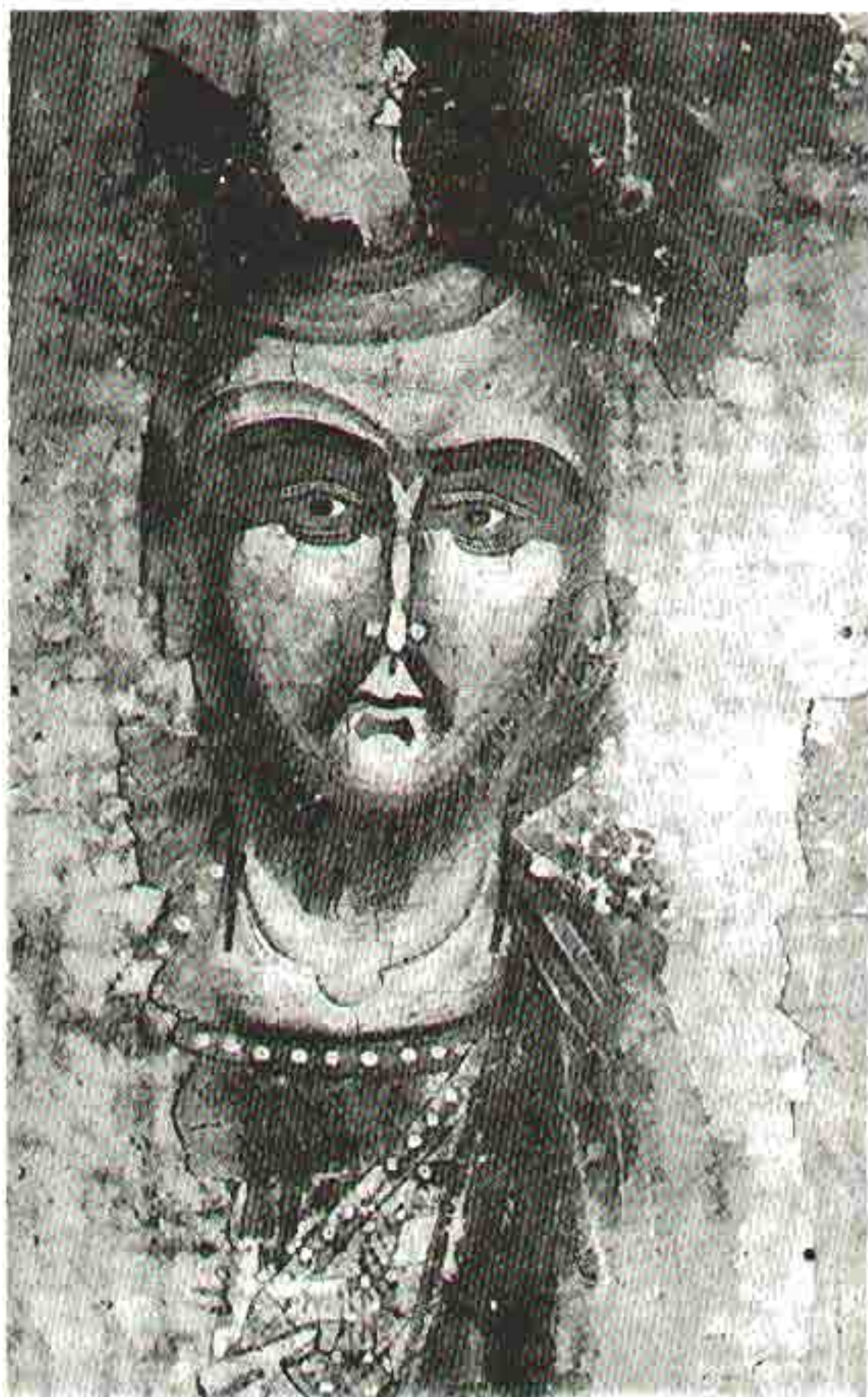
Isus Hristos, detalj ikone Sv. Trojica, Poboři