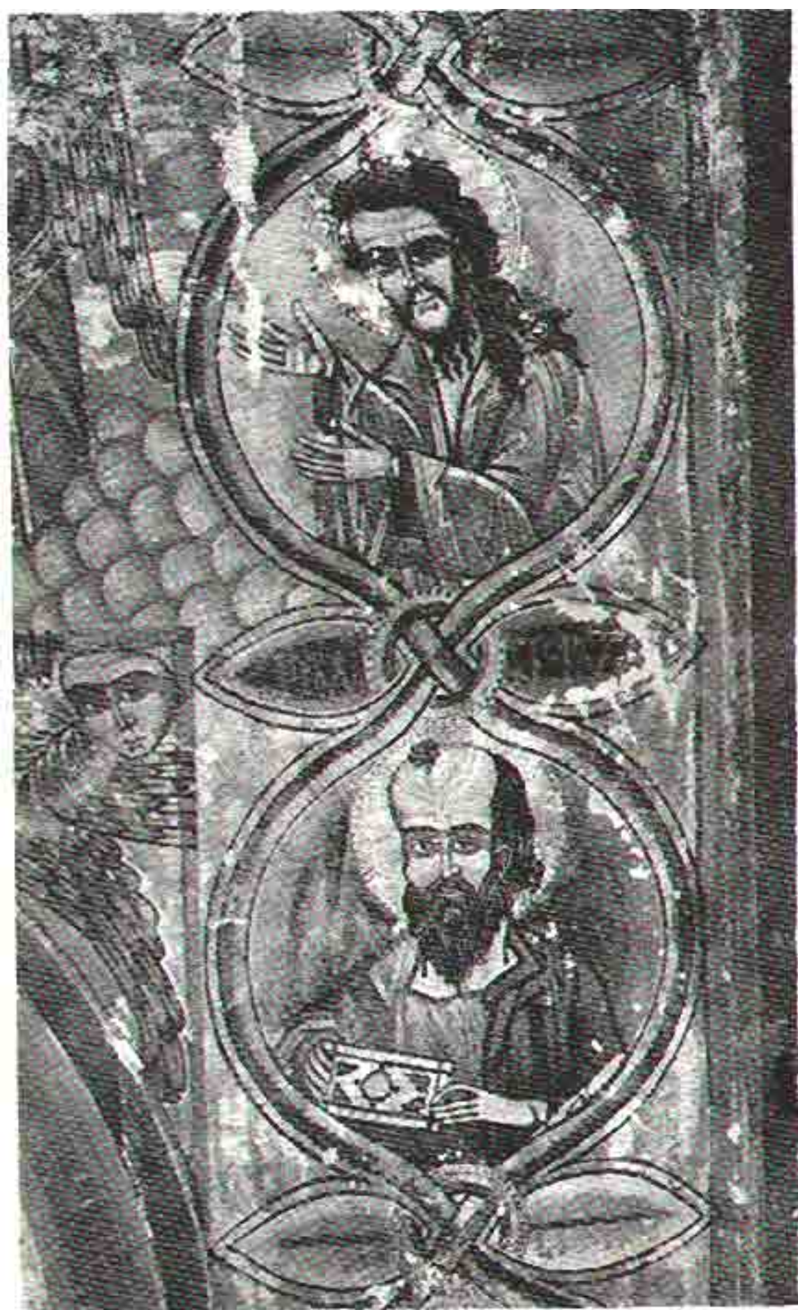
Apostoll, detali ikone Hristos s apostolima, Niegusi