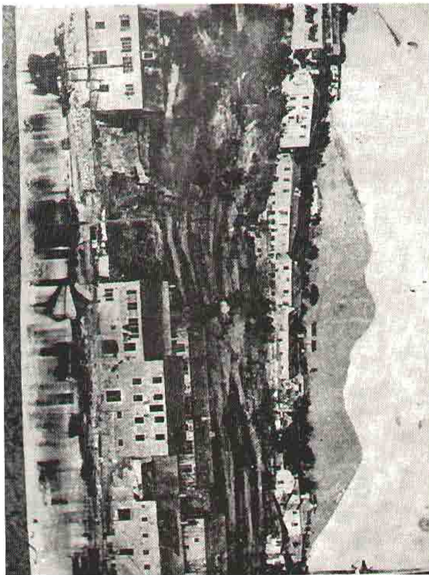
Херсон: Холм ипуше' на паратке. ЖК №29ИИСУК' ипузе