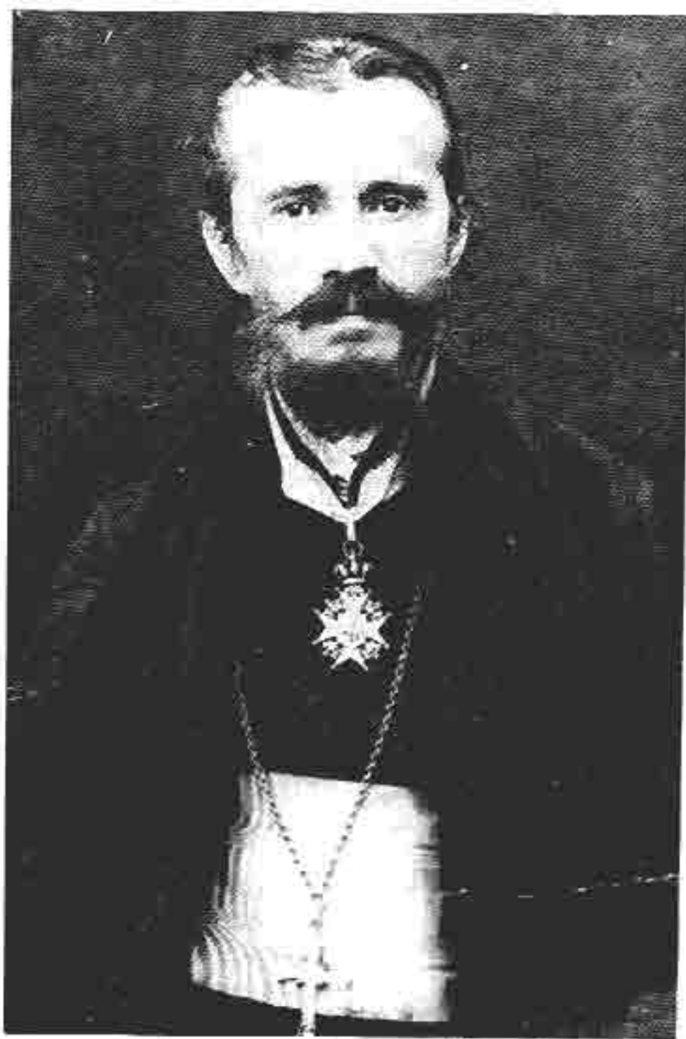
Архимандрит Дионисије Миковић (1861 — 1942)