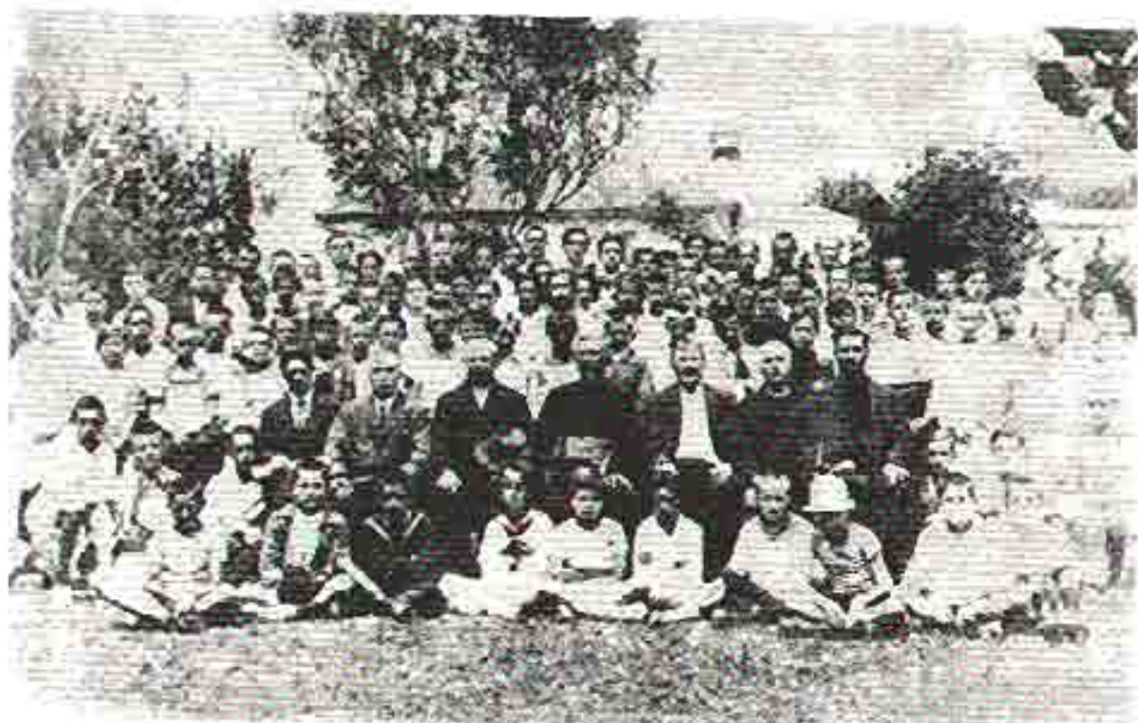
Прва генерација ниже гимназије са наставницима (1919). У позадини школска зграда.