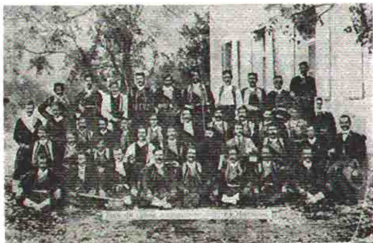
Задругари Српске Земљорадничке задруге у Мокринама