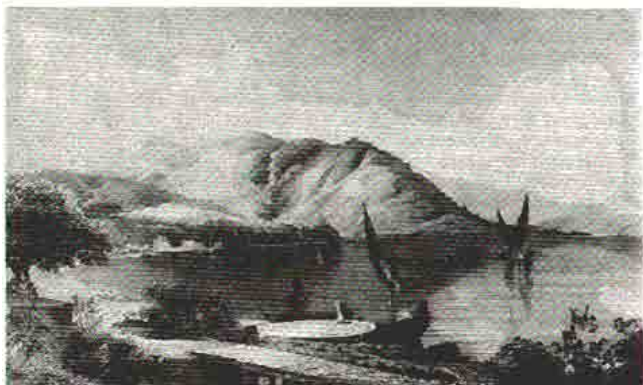
Meljine prije izgradnje Lazareta