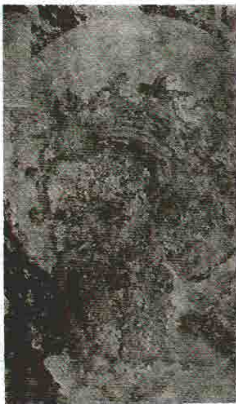
Sl. 4. Lik apostola u crkvi sv. Mihaila u Kotoru

koju deceniju, te bi se prema tome slikarstvo u crkvi sv. Mihaila moglo smjestiti u četvrtu ili petu deceniju XV vijeka. Takvu hronologiju potkrepljuju i neki ikonološki momenti prisutni u živopisu Sv. Mihaila, prije svega zagonetni prorok, kojega identifikujemo kao Danila.