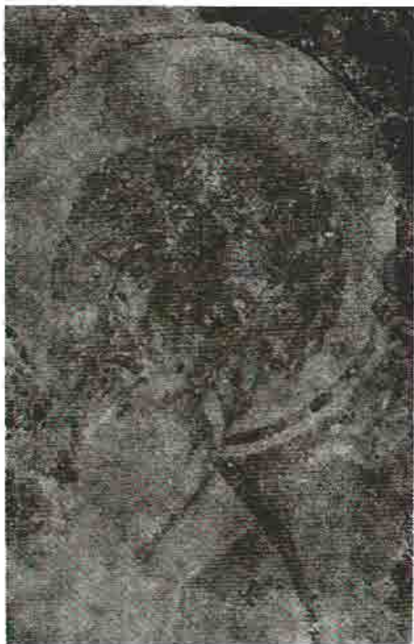
Sl. 3. Lik apostola u crkvi sv. Mihaila u Kotoru

raciju na dijelu zida u crkvi sv. Mihaila, a vjerovatno i još ponegdje. Ukoliko je najnovije čitanje osakaćenog fresko-natpisa u Stolivu definitivno, 15 onda je freske u Stolivu izradio Mihailo iz Kotora, a njegov učitelj je bio Jovo iz Debra — mogući slikar fresa-