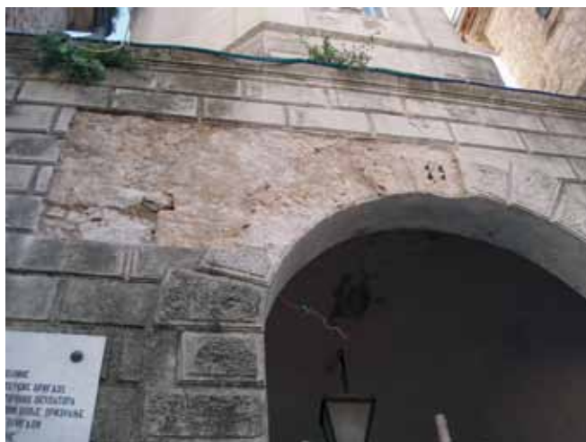
Sonda na sjevernoj strani lučnog dijela otvora (zapadna fasada)