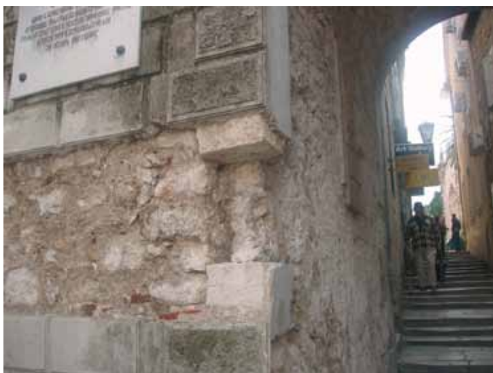
Sonda u dijelu naknadne ispune ivice lučnog otvora gradskih vrata