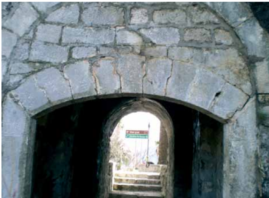
Vrata od Mora, izgled prema zapadu

natpis izvorno stajao nad Zapadnom kapijom grada, između segmentnog i gornjeg luka koji je uokviravao ovaj prostor. 15