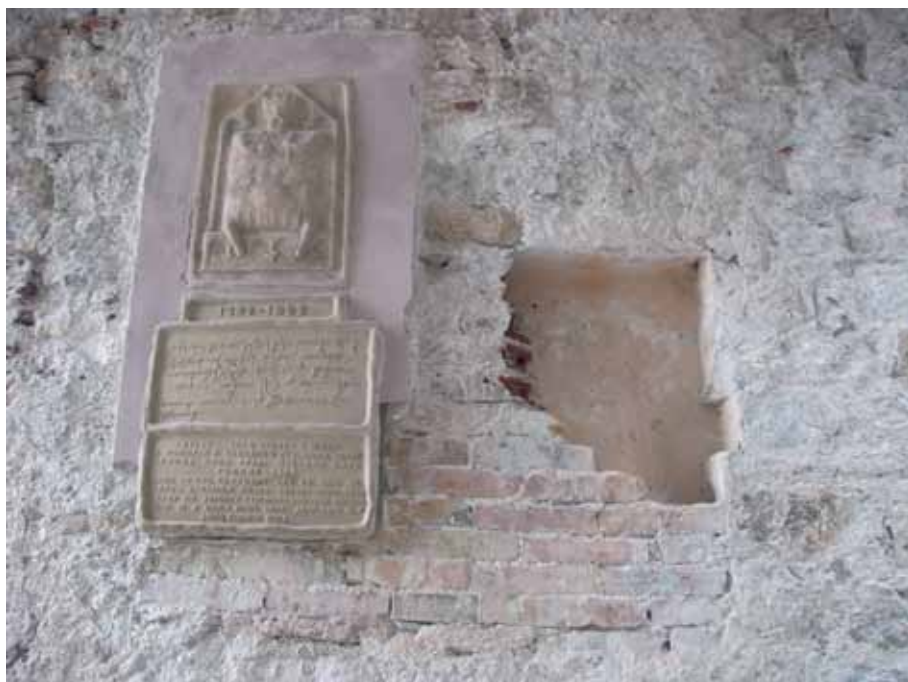
Sonda na sjevernom zidu zasvedenog prolaza

U sondi na sjevernoj strani zasvedenih gradskih vrata otkriveno je originalno zidanje samog prolaza sa sačuvanim podacima o obradi kamena i dersovanim spojnicama izvedenim sa krečnim malterom. U središnjem dijelu zida otkrivena je opekom zazidana niša čije površine su obrađene malterom.