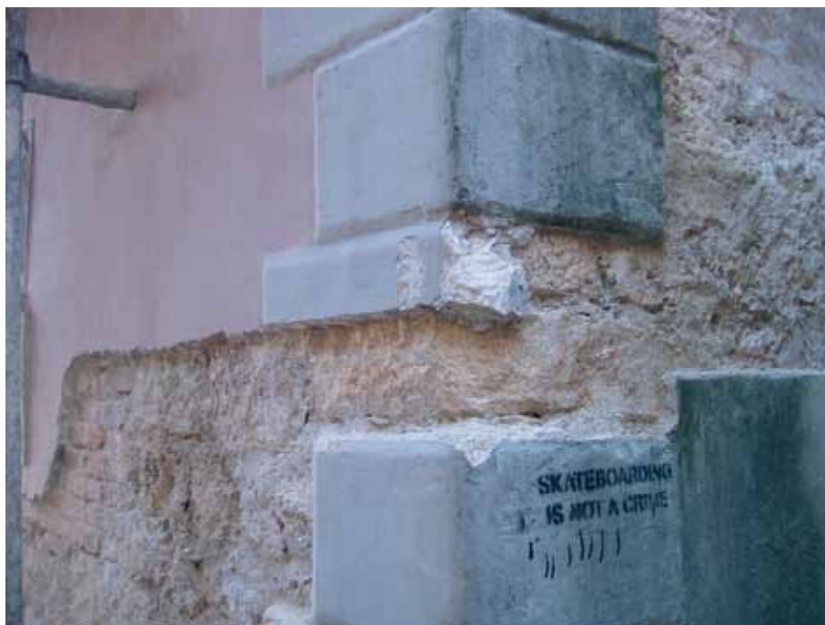
Sonda na sjeveroistočnom uglu prvobitne kule nad gradskim vratima

Ispitivanje na ovom mjestu prošireno je postupnim uklanjanjem slojeva bojjenih premaza na površini ugaonih „blokova“ izvedenih u malteru. Utvrđeno je da se prvobitnom obradom ugaonih blokova imitirala neravna površina kamena.