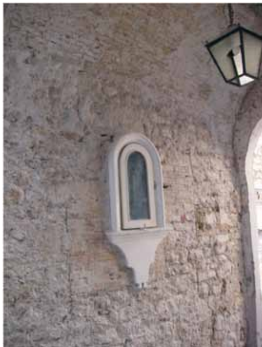
Južni zid zasvedenog prolaza

Novog odnosno Vrata prema Podgrađu. Na njihovoj zapadnoj strani stajala je Zapadna kapija grada čiji je kameni okvir sa krupnim blokovima koji su formirali dovratnike i segmentnim lukom u čijem tjemenu je stajao blok ukrašen reljefnim ukrasom u vidu rozete ispunjene motivom pješčanog sata i obojen crvenkastom bojom, bio uklonjen u vrijeme izgradnje osmougaone kule. Djelovi uklonjenih dovratnika i segmentnog luka su u sekundarnoj upotrebi korišćeni za formiranje dovratnika lučnog prolaza ispod osmougao- ne Kule sa satom koja je zamijenila stariju odbrambenu kulu čiji izgled je zabilježen na crtežu Fedora Karačaja iz 1837. godine. Prilikom gradnje osmougaone kule srušen je originalni svod nad prolazom i izveden je novi zidan opekom. Zazidane su i niše na sjevernom i južnom zidu prolaza koje su izvorno mogle služiti za potrebama gradske straže.