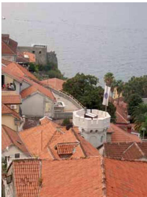
Kula gradskog sata u Herceg Novom; pogled sa Kanli kule

Odbrambena kula nad zapadnim gradskim vratima je pretrpjela niz pregradnji od kojih su evidentne dvije i to obnova nakon velikog zemljotresa od 1667. godine i pregradnja kule 1856. godine kada je nastala osmougaona kula sa satovima. I nakon 1856. godine intervenisalo se na uređenju građevine a među njima u najopsežnije spadaju radovi izvedeni posle zemljotresa od 1979. godine.