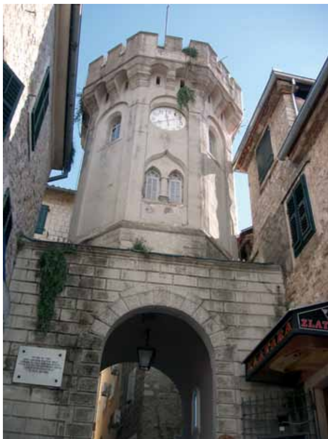
Zapadni izgled kule gradskog sata

Cijela unutrašnjost kule je omalterisana i bez ukrasnih elemenata.