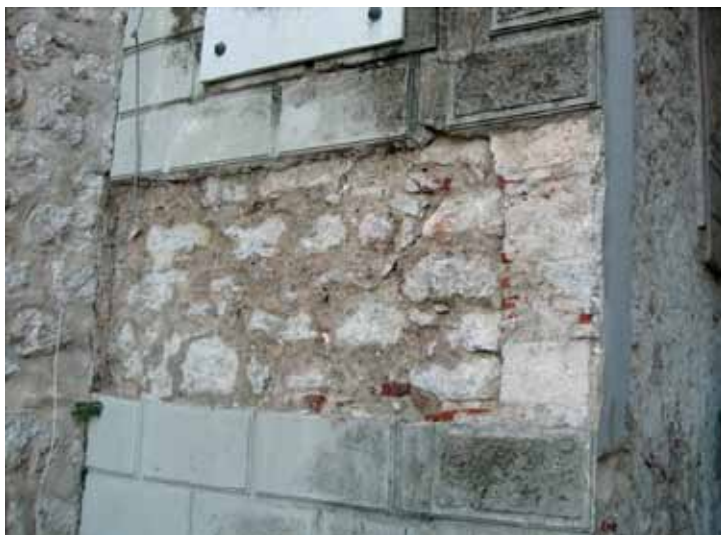
Sonda u malteru na zapadnoj fasadi, sjeverno od gradskih vrata

U daljem postupku istraživanja demontirana je naknadno formirana ivica otvora kako bi se utvrdili podaci o izvornoj obradi lučnog otvora.