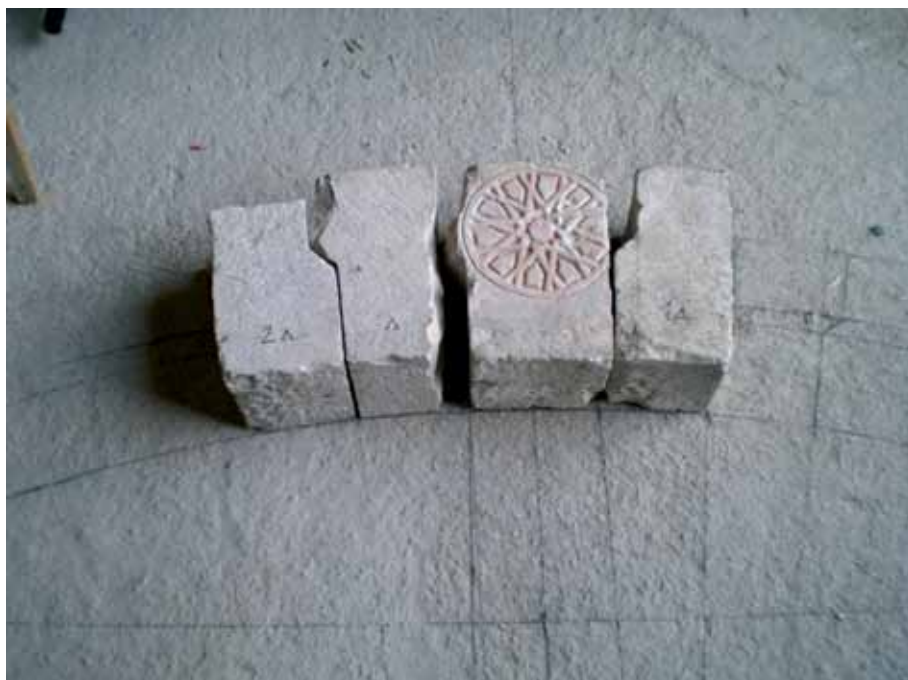
Originalni djelovi luka portala Zapadne kapije