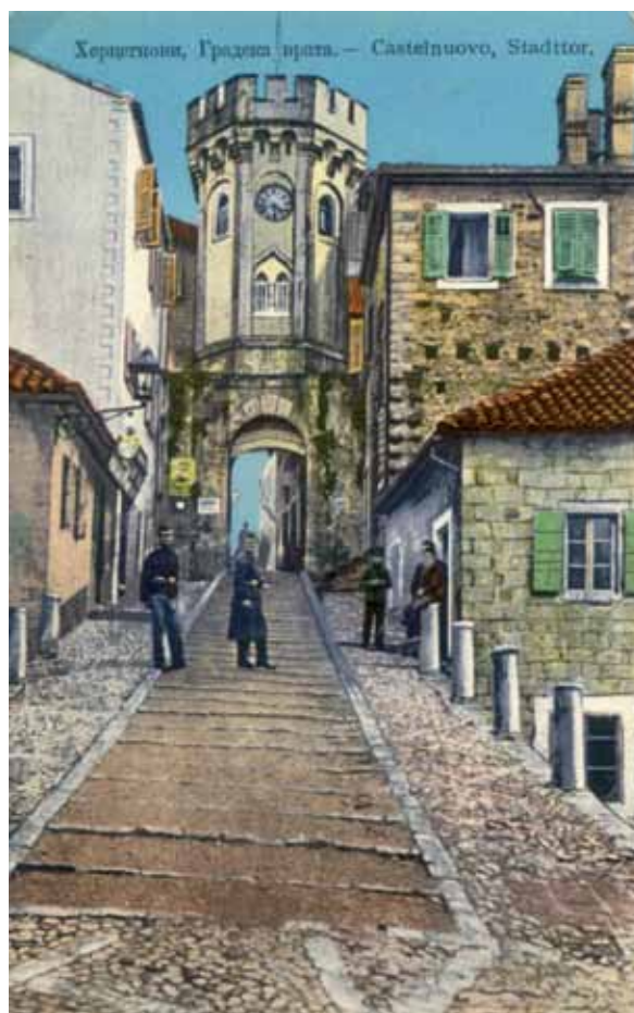
Kula gradskog sata sa kaldrmisanim prilazom u vidu rampe, 1914. g.

Na veduti koja se čuva u zbirci Zavičajnog muzeja u Herceg Novom prikazan je izgled grada sa zapadne strane sa dvjema tvrđavama i stjenovitim terenom na kome je podignut gradski zid. 9 Na crtežu su prikazana dva puta od kojih široki vodi prema ulazu u grad (Kopnena vrata) a drugi, ka Vratima od mora koja se nalaze na zidu sjeverno od Forte Mare.