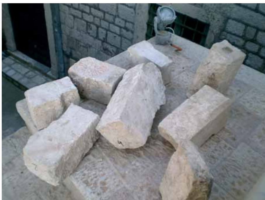
Originalni djelovi dovratnika i luka prvobitne Zapadne kapije