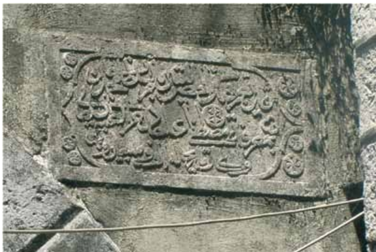
Natpis na na istočnoj fasadi gradskih vrata

Budući da se natpis odnosi na godinu u kojoj se dogodio veliki zemljotres koji je pogodio kako Herceg Novi tako i susjedne gradove, posebno Dubrovnik i Kotor, ne može se isključiti mogućnost da se pomenuta gradnja kule odnosi na njenu obnovu nakon oštećenja koja je izazvao potres i na zapadnoj strani gradskih zidina. U tom slučaju 1667. godina bi predstavljala gornju granicu vremenskog okvira u kome je kula mogla nastati.