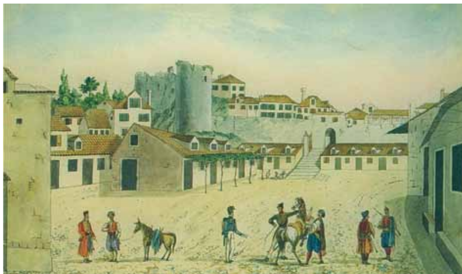
Akvarelisani crtež Fedora Karačaja iz 1837. godine

istom arhivu čuva se i saglasnost vojnih vlasti sa sjedištem u Kotoru za podizanje kule sa satom, međutim, arhitektonski crtež za gradnju kule, pomenut u oba dokumenta, nije sačuvan.