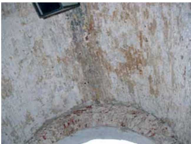
Sonda na svodu prolaza u gradskim vratima

Podaci dobijeni u sondi na dijelu zatečenog lučnog otvora zapadnih gradskih vrata pokazuje da je prilikom gradnje novog svoda od opeke bio uklonjen i originalni luk otvora.