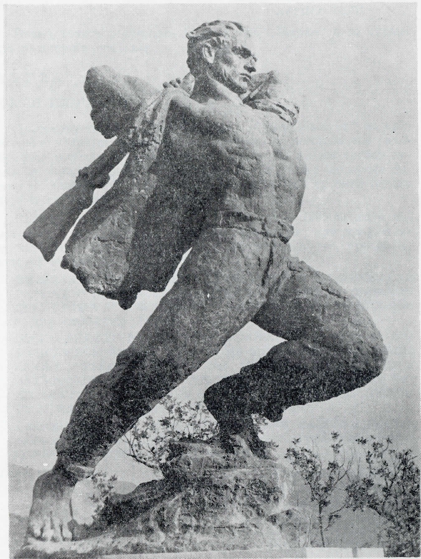
Споменик палим борцима — Херцег-Нови (Аутор Л. Томановић, вајар)