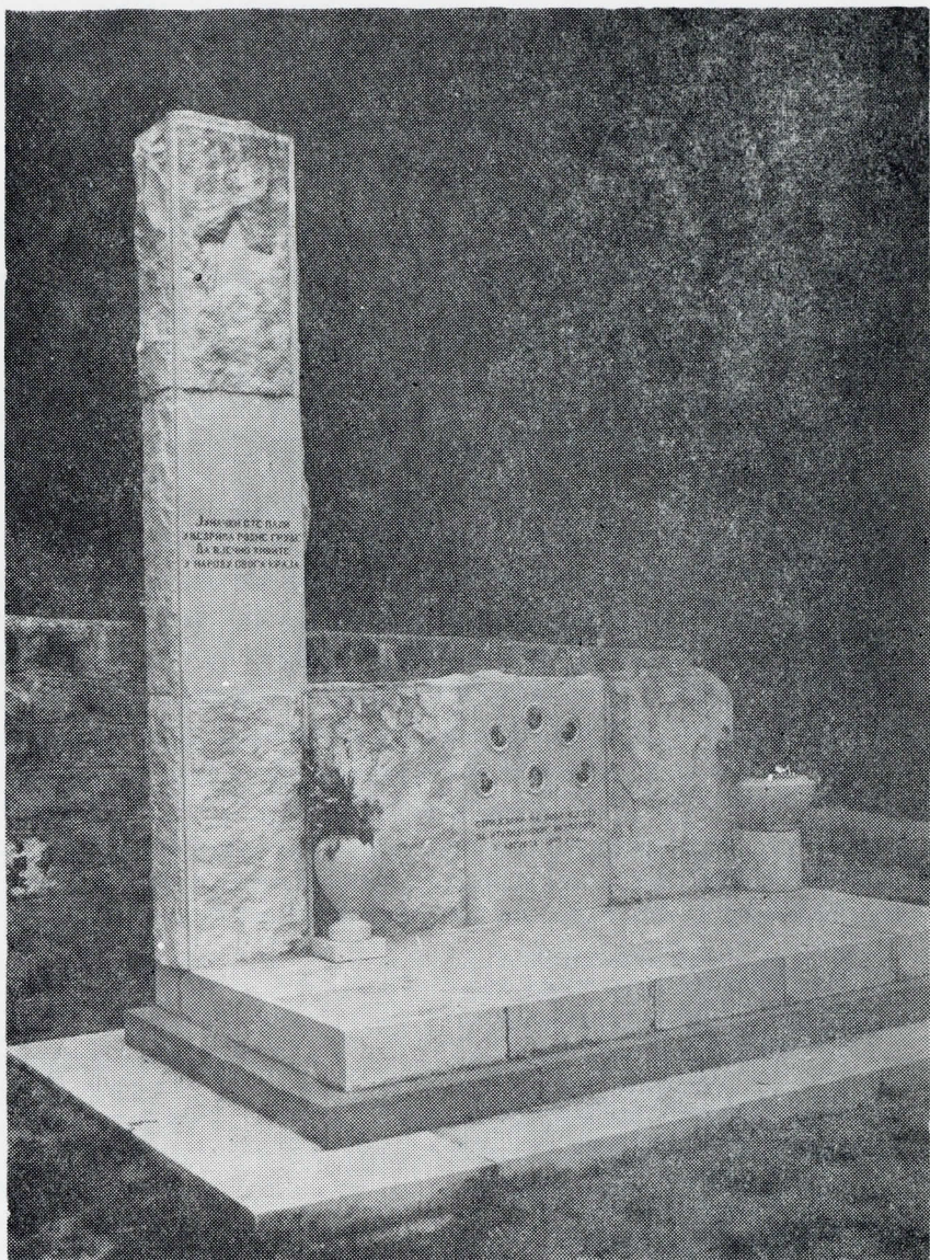
Споменик стријеланим родољубима — Баошић