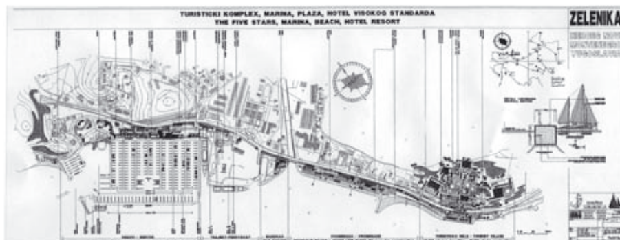
sl.05 urabnističko rješenje Zelenike sa maritimnim karakt., autor sa saradnicima 1993. god.

Ne treba zanemariti i formiranje putničko teretnog terminala, i trebalo bi predvidjeti i trajektne veze sa Italijom i Grčkom, kao i stalnu gradsku trajektnu vezu sa Rosama i susjednim poluostrvom Luštica.