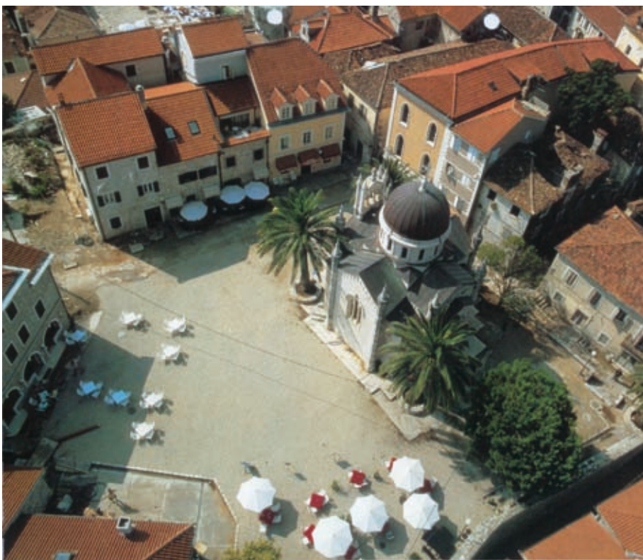
sl. 03 Izvorni glavni trg grada - piazza

Ponavlja se konstatacije da je grad Herceg Novi i njegov prostor dio konurbacije »Bokapolisa«. Dakle ovaj dio Boke ima potencijal čistog i amfiteatralnog gradskog zaliva, povoljne klimatske uslove. Prostor je definitivno vezan za more i uz more. Dalje ima potencijal konfiguracije terena, reljefa i topografije, visoke planine i plodne ravnice. Ima i potencijale podzemnih vodotokova i adekvatnih mineralnih i ostalih voda. Amfiteatralna brda i padine okrenute prema suncu i kvalitetnoj insolaciji. Prisutna su značajna vazдушna strujanja i »miješanja planinskog i morskog vazduha«.