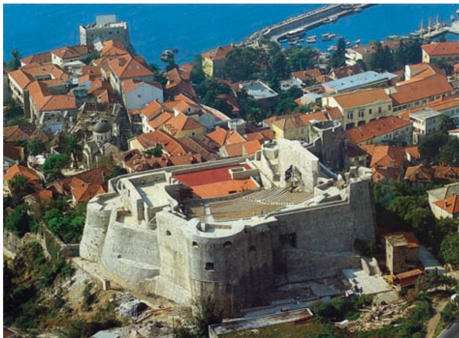
sl. 01 Urbani nukleus i početak Herceg Novog, Kanli Kula