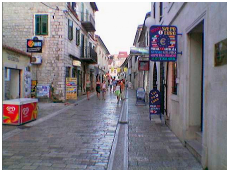
sl.02 Herceg Novi, Burg-podgrađe