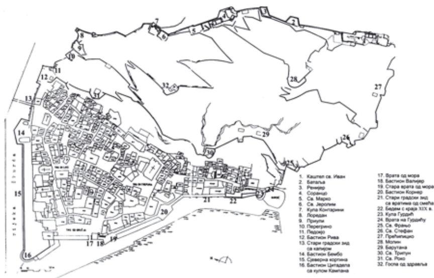
Slika 1. Plan Kotorske tvrđave

koje su priznali Kotoru prilikom predaje, a grad je u privrednom smislu nazadovao, ali je u strateškom pogledu dobijao na značaju, što je za posljedicu imalo povećano interesovanje za njegova utvrđenja.