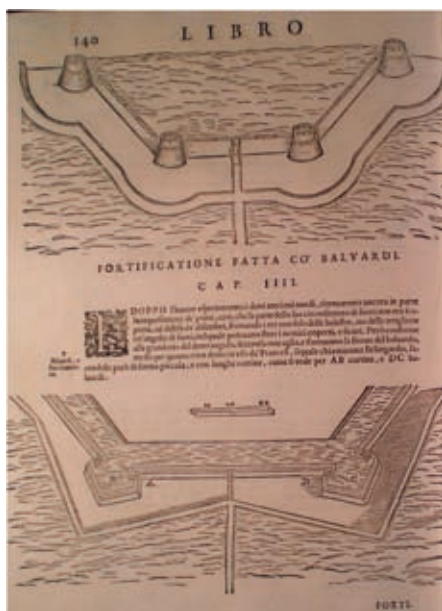
Slika 7. Prelazak sa kružnih na poligonalne bastione (B.Lorini, Delle Fortificationi , Venezia 1597, korišćen primjerak iz Fine Arts Library, Philadelphia)