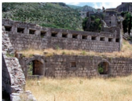
Slika 20. Položaj Sv. Jerolim