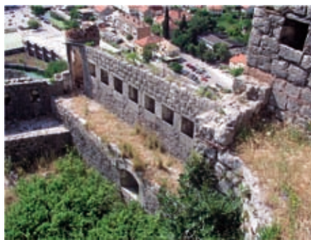
Slika 23. Položaj Zen