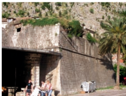
Slika 3. Bastion Korner

rončija iz 1785. godine označen kao “ Piattaforma S. Francesco rovinosa ” (Sl. 1., položaj br. 22). Nije nam poznato vrijeme nastanka ovog bastiona. Sudeći po istorijskim podacima bastion je doživio radikalnu rekonstrukciju 1590. godine, za vrijeme providura Pizanija. Krajem 19. vijeka austrijske vlasti srušile su već značajno oštećeni bastion, radi prolaza priobalnog puta. Na njegovom mjestu, a u pravcu srednjovjekovnog zida ojačanog kontraforima, sagrađena je eskarpa koja se po opusu teško može razlikovati od mletačkog zida. U gornjem dijelu novog zida, tom prilikom je ugrađeno nekoliko spolija sa grbovima, uključujući i natpis providura Pizanija