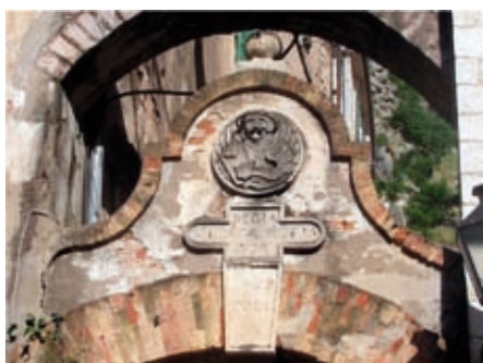
Slika 14. Ulaz u Kotersku tvrđavu na brdu sv. Ivan, 1760. g.