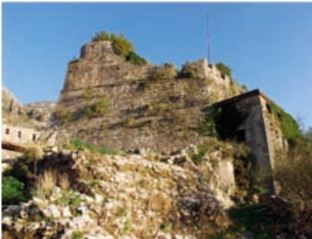
Slika 10. Kaštel Sv. Ivan

Prve mletačke radikalne intervencije na dijelu tvrđave u brdu bile su izgradnja Kaštela na vrhu brda Sv. Ivan ( Castello over Fortezza, Castello San Giovanni, Citadella ) krajem XV vijeka. On je praktično, do današnjih dana, spolja ostao u nepromijenjenom obliku iz tog vremena (sl. 10), a sačuvana je i autentična kapija iz vremena gradnje (sl. 11). Karakterističan je njegov oštri sjeveroistočni ugao ( sperone ), čija gradnja se često pominje u istorijskim izvorima (sl. 12). Kaštel je kasnije dobio spoljašnji ulaz sa pokretnim mostom i niz objekata u unutrašnjosti, uključujući i nekoliko intervencija iz vremena Austrougarske monarhije. S obzirom na njegov položaj, evidentno je da je kaštel bio praktično neosvojiv sa strane brda. Mlečani su u više navrata čak minirali, sjekli brdo, da bi ga učinili još nepristupačnijim.