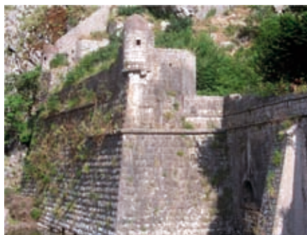
Slika 9. Bastion Riva