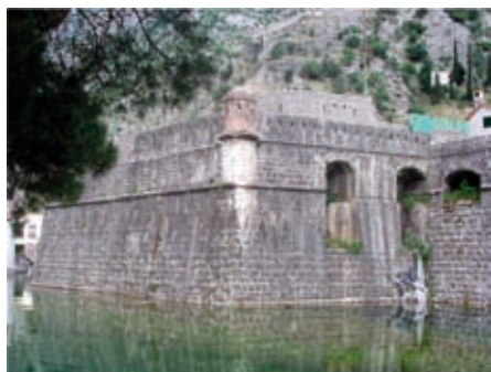
Slika 8. Bastion Bembo ( Vendramin )

Posljednji bastion u području grada, od kojeg počinje pojas utvrđenja u brdu nosi naziv Riva , (sagrađen u vrijeme providura Alojza Rive 1540-1542., sl. 9). On se koristio kao ljetnja pozornica od pedesetih godina do izgradnje