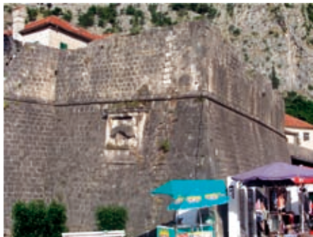
Slika 5. Bastion Valijer

lizacije, koji u prostoru između starog bedema i spoljašnjih zidova bastiona predviđa ugostiteljski objekat i galeriju, a ispred stare kapije, sa unutrašnje strane, ulaz i baštu restorana.