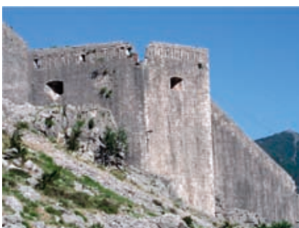
Slika 15. Položaj Renijer,