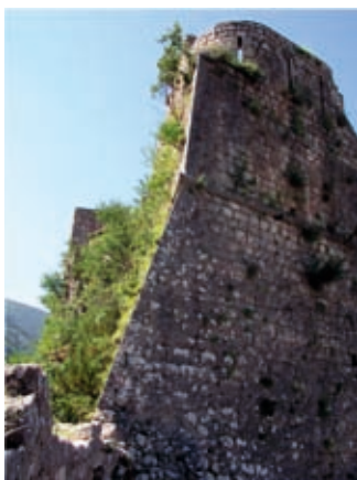
Slika 12. Ugao Kaštela ("sperone")