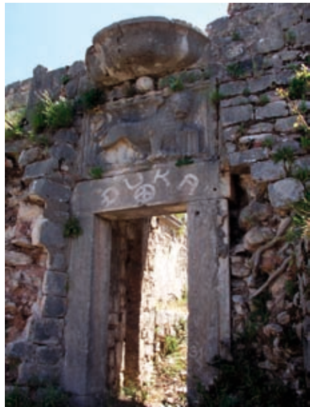
Slika 11. Ulaz u Kaštel. XV vijek

Rekonstrukciji utvrđenja u brdu Mlečani dugo vremena nisu posvećivali veću pažnju. Održavali su i popravljali postojeći srednjovjekovni sistem bedema i kula [5]. Nešto veće opravke morale su se preduzeti poslije oštećenja u toku turskog napada 1657. godine, o čemu svjedoče zapisi o upotrebi kamena sa porušenog manastira Sv. Franja na Gurdiću za rekonstrukciju položaja Batalja (sl. 13). Tek krajem šezdesetih godina XVIII vijeka preduzete