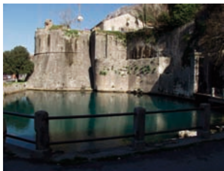
Slika 2. Kula Gurdić