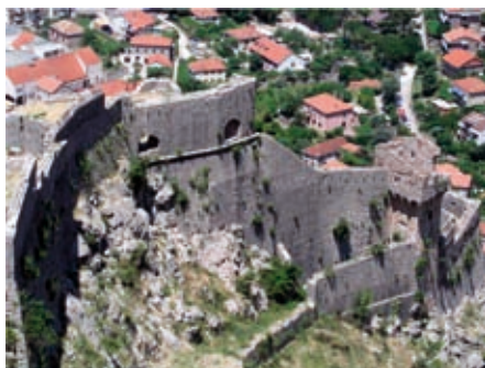
Slika 19. Položaj Sv. Jerolim sa redukcijom i kulom Kontarini