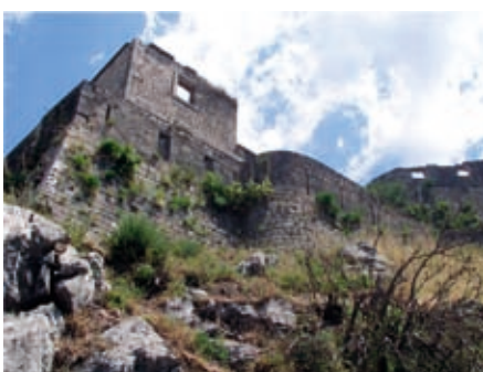
Slika 17. Mala tvrđava (Posto Soranco)