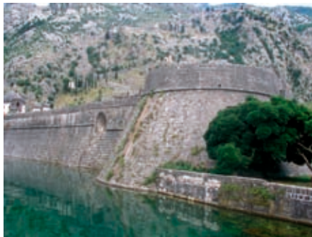
Slika 6. Citadela

Produžujući šetnicom iznad glavnih gradskih vrata, koja je ujedno i galerija za pristup pojedinačnim prostorima kompleksa Kule gradske straže, Providurove palate i Vjećnice, dolazi se do jednog od najznačajnijih utvrđenih gradskih položaja, Citadele (“Citadela” ili “Campana”). U vrijeme kada je nastala, početkom 16. vijeka, Citadela je bila autonomno gradsko utvrđenje koje se moglo braniti i u slučaju predaje grada (Sl. 6). Ona je kasnije povezana