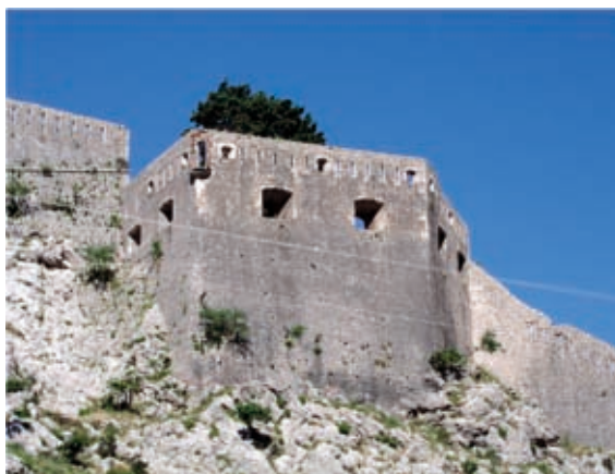
Slika 13 . Položaj Batalja