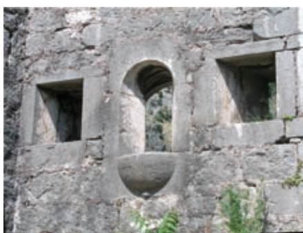
Slika 16. Karakteristične puškarnice, XVIII vijek