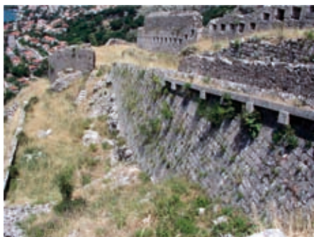
Slika 18. Položaj Sv. Marko, oluk i cistijerna

Kula Kontarini do sada se datirala u 1571. godinu [3], iako se najvjerovatnije radi o vremenu gradnje kule na Gurdiću (oko 1470. godine). Međutim, bez obzira na datum, ovdje se bez sumnje, slično kao i za kulu Loredan , radi zapravo o objektu sa izrazitim srednjovjekovnim karakteristikama [5].