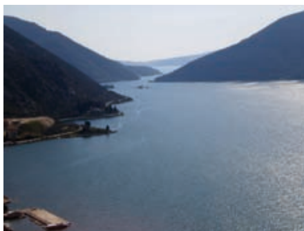
Пољег на Вериже са ѡуја изнаг Рисна