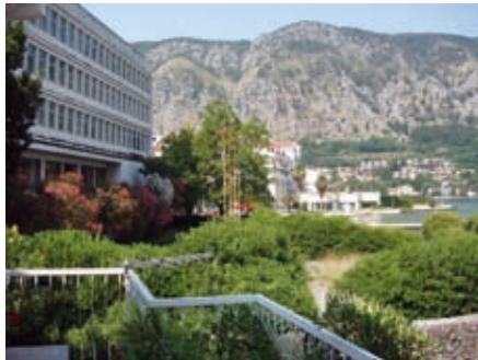
Југооцеанија и хотел Фјорд