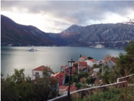
Поглед из Пераста на Морињ и Лијце

4.4 Насеобине у њприобаљу залива. Обухватном хронологијом и опсегом истиче се Рисан, антички Rizon. У приобалном појасу которско-рисанског залива развијене су некадашње поморске општине: Пераст, Доброта, Прчањ, Столив. Поред њих су мале насеобине ратара и рибара: Муо, Ораховац, Морињ, Костањица. Између гломерација пружају се