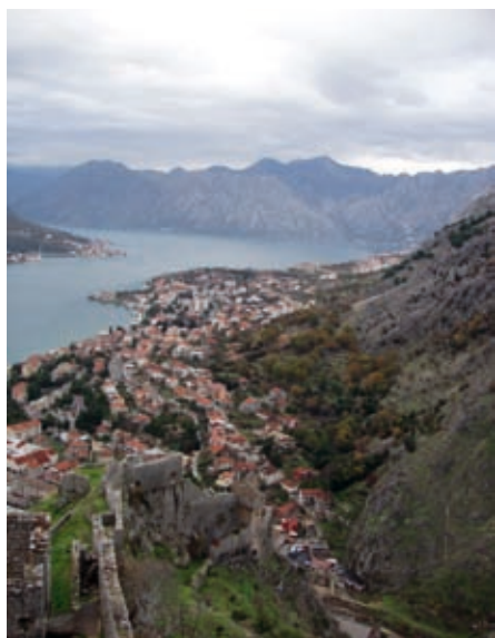
Пољлед на Добројџу

Трасирањем колског пута у приобаљу, Доброта је лагано претварана у линеарну агломерацију најдужу у Боки, на чијем је завршетку не-