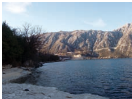
Пуј и Лијци, ѡљег из Косјањице