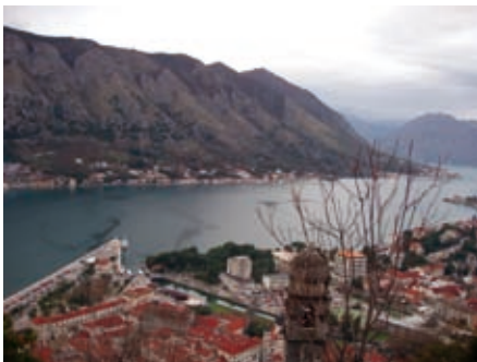
Пољед из Коџора на Врмац