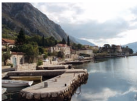
Љуџа, сачувана ауџенџичносџи џриобалноџ дијела