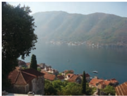
Перасиј и Столиву

4.4.5 Столив. Обухвата две насеобине: Горњи и Доњи Столив. Први је сеоце на стројј падини обраслој непроходном шумом питомог кестена која је заштићена као природна реткост. Са виших ката околног терена сагледавају се залив и залеђе Боке. Насеље чини неколико групација једносратних кућа рустичне обраде, са терасама и вртовима по комсом терену. У панорами места доминира звоник сеоске цркве. Напуштена стара агломерација требало би да прође кроз упоредну анализу могућих садржаја ревитализације у јединственом окружењу са помешаним микроклиматом од морских испарења и свежине кестенове шуме. Са таквим квалитетом окружења Горњи Столив може преузети значајну улогу