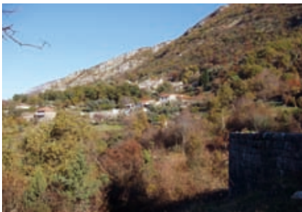
Брајџешићи, Горњи Грбља

4.4.7.3 Горњи Грбља. На падинама Ловћена, изнад поља, подигнуто је десетак насеобина Горњег Грбља. Најнижа је Ласџива изнад поља. У међунивоу је Дуб код превоја Свете Тројице, а највише је планинско село Мирац , устројено по изохипсама. У зависности од конфигурације терена, села су збијена, или образована од групација породица и братстава чија презимена носе. Зона обилује питком водом из планинских врела. У Мирицу , на висини од неколико стотина метара