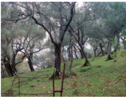
Маслињак у Столиву