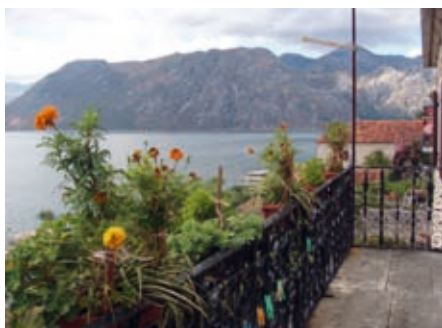
Пољлед са балкона џлациџе Ивановиџ- Ђејковиџ Ив