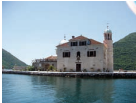
Осипрво Госије од Скријела

Урбана формација Пераста битно се разликује од осталих насеља у приобаљу залива компактном структуром, мада није била омеђена појасом фортификација, које су иначе чиниле битно обележје градских целина. Његову урбаност стварали су сталешка припадност и социјални састав становника племићког и грађанског порекла, имаоци великих аграрних поседа, власници трговачких једрењака, капетани дуге повидбе, достојанственици клера.