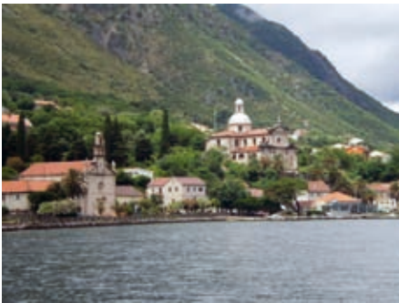
Прчањ, поглед са брода

У другој етапи, после ослобођења Боке Которске од турске окупације, постепено се формирала оперативна обала са пристанима за трговачке једрењаке и магазиама за бродски товар и опрему. На граници пристанишног појаса подигнут је низ кућа и ансамбала за рад и боравак. Међу каменим зградама истицали су се џалаци племића и грађана, власника бродова, капетана и трговаца. Иза кућа формиран су вртови, баште, воћњаци, виногради и маслињаци. На периферним позицијама подигане су скромне приземнице ратара и рибара.