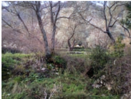
Маслињаци у горњим зонама Прчања