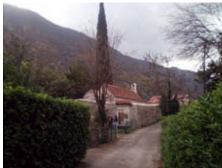
Црква св. Тријуна у Морињу

појасеви обрадивог земљишта: повртњаци, виногради, маслињаци, агруми. Атари суседних насеобина местимично су раздвојени стеновитим и шумовитим гребенима који се спуштају до мора.