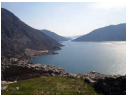
Рисан, иоџлед са Градине