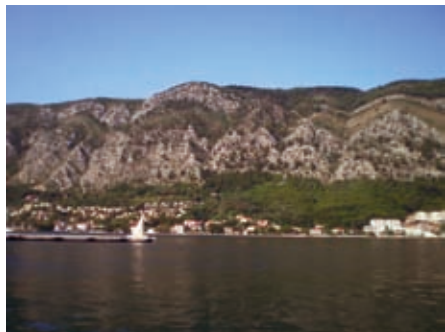
Муо - двије генерације савремене стамбене зградње

4.4.6.2 Муо. Рибарско насеље у приобаљу Врмаца надовезује се на линеарни низ дуж пута, недалеко од Старога града. Сукцесивном градњом затворен је обални прстен. Простори могућег ширења налазе се на стр-