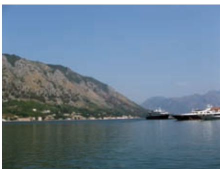
Пољед на Муо из коџорске луке

мој падини изнад места. У зонирању будућих намена треба предвидети нове функције старих складишта (радионице, хангари пловила, продавнице и друго).