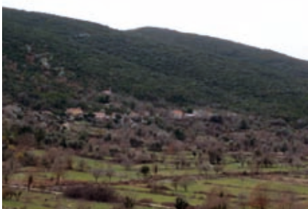
Село Коваци у Доњем Грбљу

4.4.7.2 Доњи Грбљ. Најстарија села образована су на падинама плодних котлина које су коришћене за садњу прехрамбених биљака. На обрадивом земљишту нису подизане никакве зграде. Овакав однос према агери чуван је столећима попут својеврсног култа. Породичне куће и групације братстава лоциране су на положајима широких видика, по изохипсама терена са стеновитом подлогом. Сadržавале су приземље и