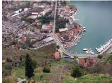
Поглед на Шкаљаре и јужни прилаз граду