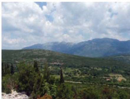
Загора, Доњи Грбљ

спрат и окружаване пратећим објектима. Грађене су од блокова грубо до-тераног камена. Поједине су покривене рустичним плочама, а већи број каналама. Оквири правоугаоних отвора формиран су од греда без профилације. Неке старе куће, оштећене земљотресом, биле су напуштене, друге су обновљене без стручних упутстава или су бивале замењене новоградњама без континуитета са традицијом.