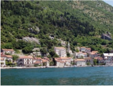
Перасиј, средишње насеља

4.4.2 Перасиј. Невелика формација опстајала је на граници која је раздвајала два света, земље хришћанске алијанске од оријенталног Царства продрлог из Мале Азије. Тек по коначном одласку Турака из Боке (Херцег-Новог и Рисна) на балканско залеђе, обална места су повратила слободу и стекла статус поморских општина у току XVII и XVIII столећа.