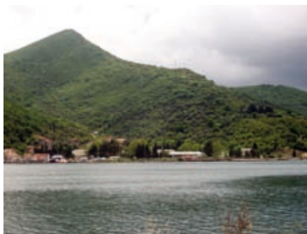
Лејейане са брдом св. Виг