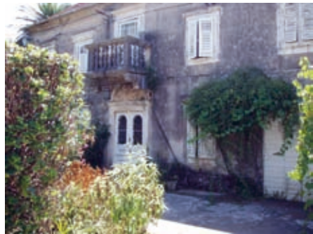
Дворишње куће породице Ђунио