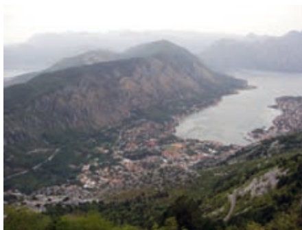
Којорски ољранак Боке1

2. Рурална садржи стара сеоска насеља на падинама изнад обалног појаса Врмца: Горњи Столив, виши појас Прчања; Шпиљари на падини у залеђу Тврђаве. Традиционално рурално подручје јесте Грбаљ који обухвата пространо поље између Тивта и Будве са две подцелине, Горњи Грбаљ према копну и Доњи Грбаљ ка мору.