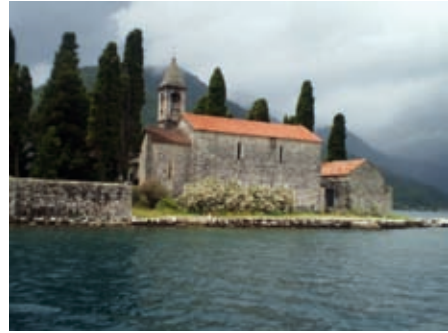
Осипрво св. Ђорђа насипрам Перасија