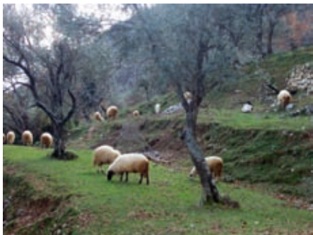
Столив, еколошка традиција