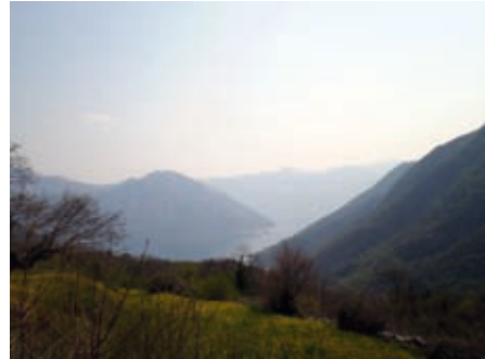
Поглед на Боку из Мориња