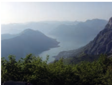
Рисански оџранак Боке