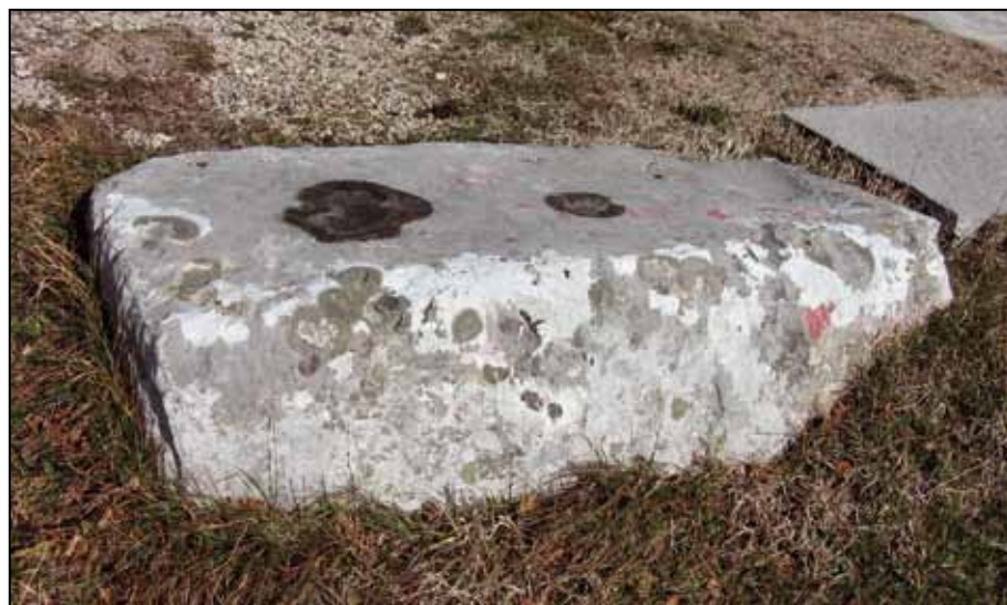
Сѣћнак у Црвеном брду (Мокрине)