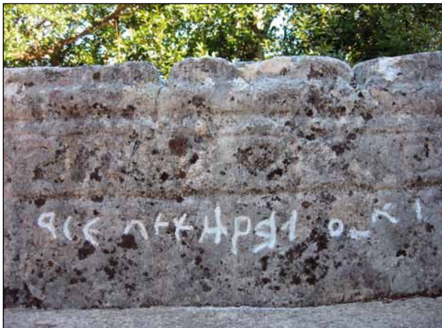
Сѣћнак у Ченићима