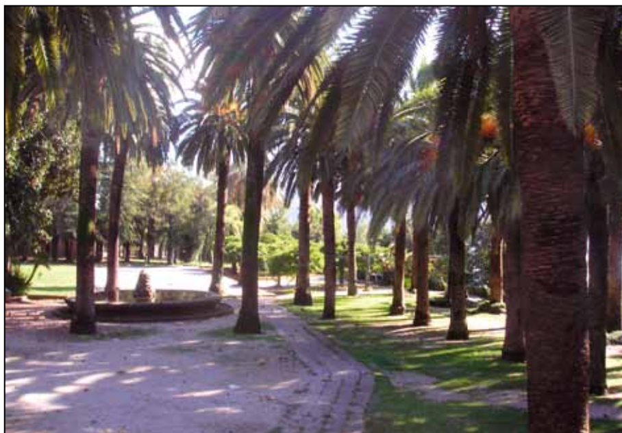
Данашњи изглед парка

флаше, папир, пластичне кесе, ... Комунално предузеће 3-4 пута годишње чисти рибњак, али након два-три дана вода је поново мутна. Ипак, и у таквој води, рибице још увијек опстају и множе се.