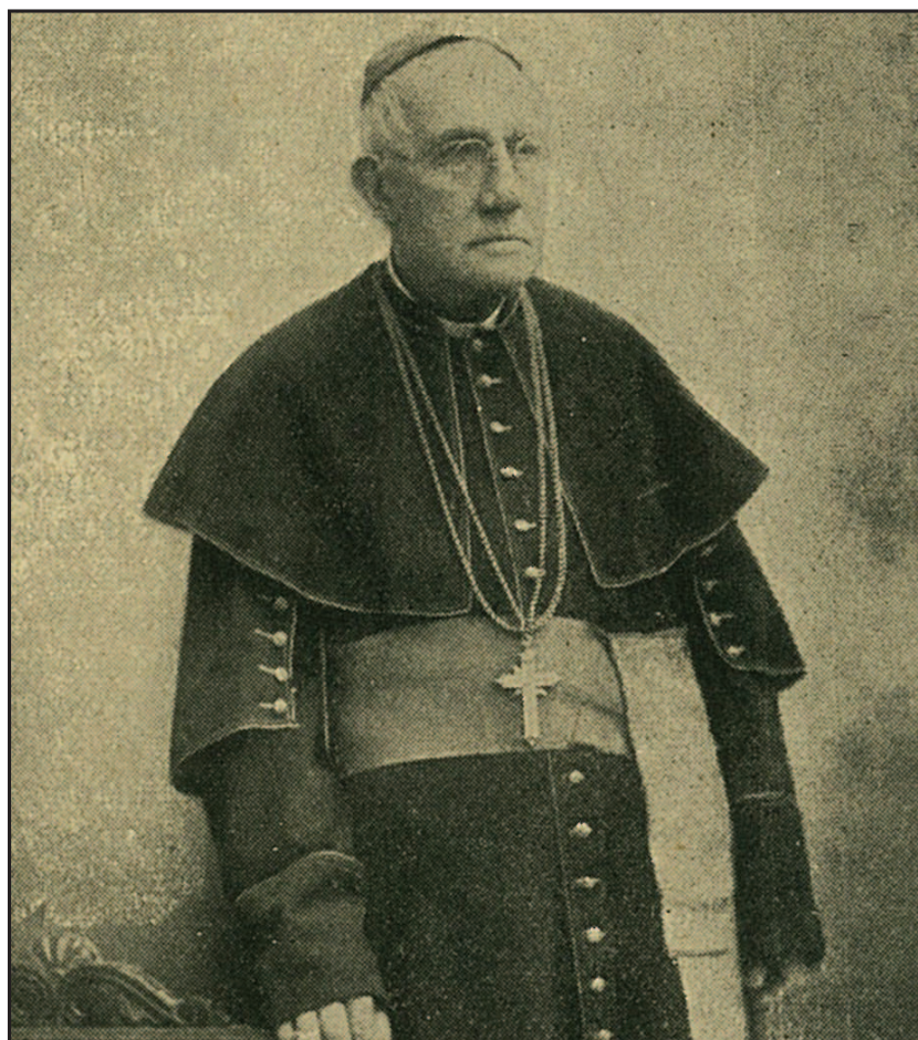
Которски бискуп Франо Ућелини