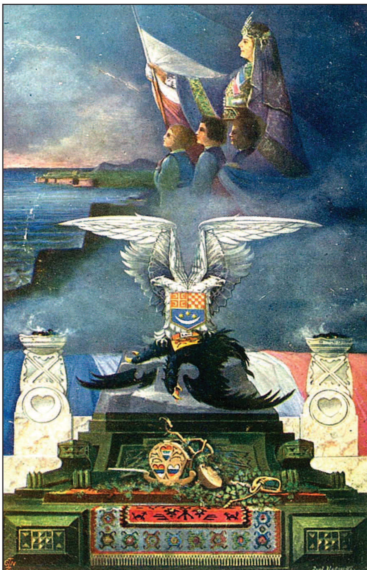
Инкиостри Уједињење 1918. год.