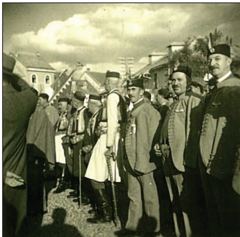
Свечаност на Цетињу око 1939. год.