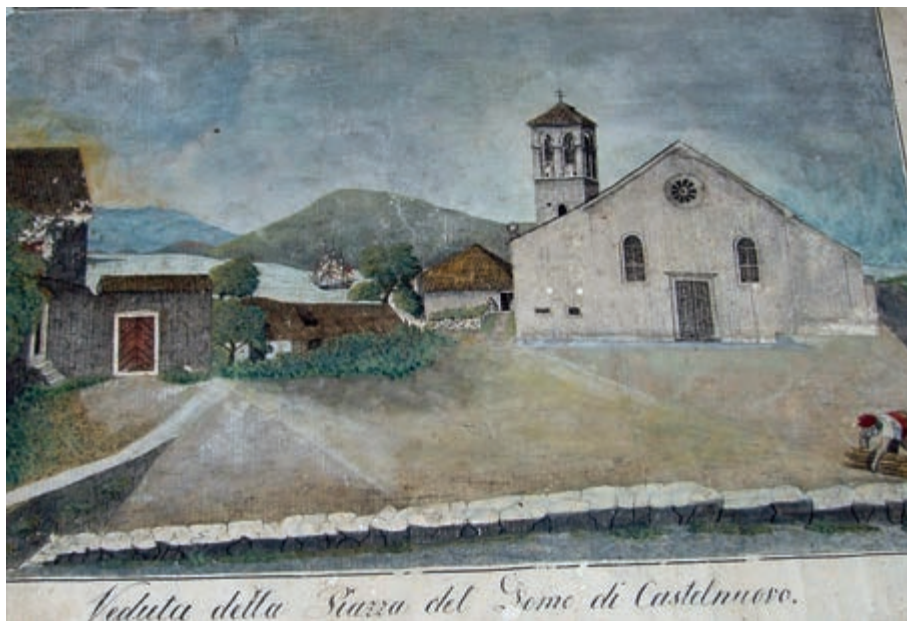
Uđe na platnu: stara црква Св. Јеронима (у цркви Св. Леополда)