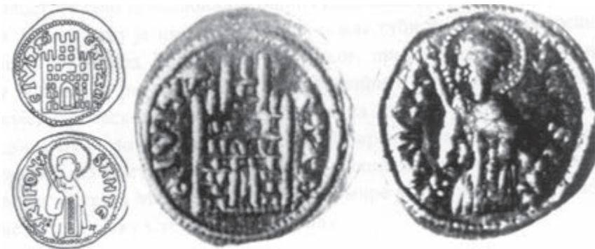
Сл. 6 Котор (градски новац). Фолар.