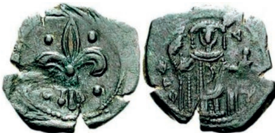
Сл. 4 Теодор II Ласкарис (1254–1258). Никејско царство, Магнезија – Номизма тетартерон.