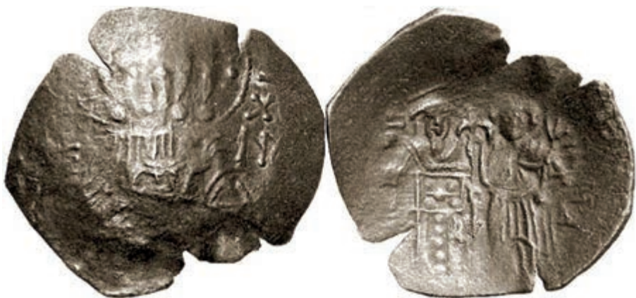
Сл. 3 Теодор II Ласкарис (1254–1258). Никејско царство, Магнезија – Аспрон трахеј номизма (1256/57).