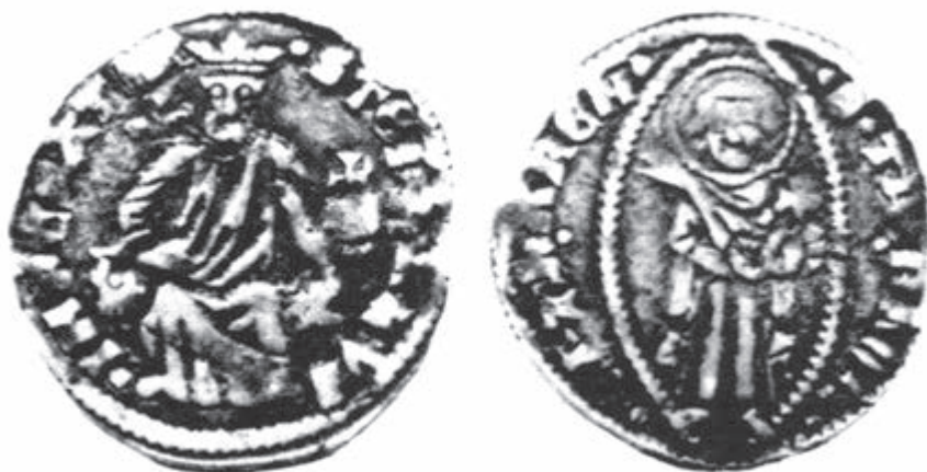
Сл. 9 Стефан Душан (1331–1355). Котор – Динар.