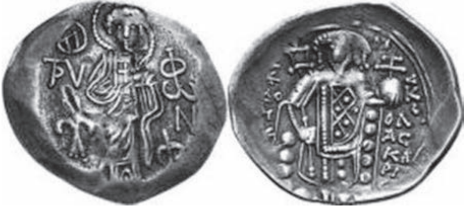
Сл. 1 Теодор II Ласкарис (1254–1258). Никејско царство, Магнезија – Аспрон трахеј номизма (1255/56).