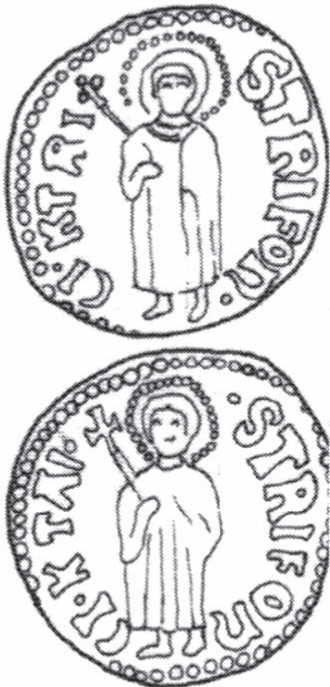
Сл. 7 Котор (градски новац). Фолар.