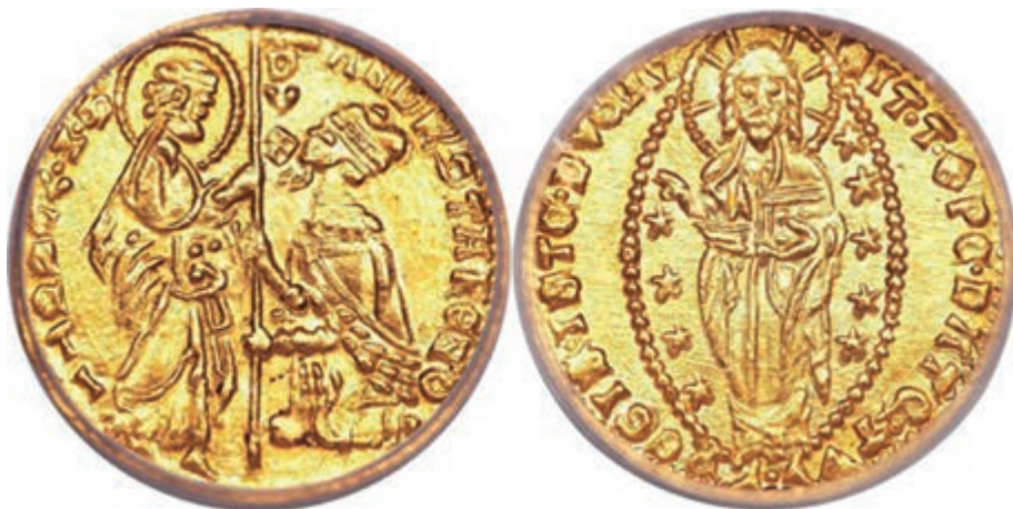
Сл. 10 Млетачка република, Венеција – Дукат, XIII век.