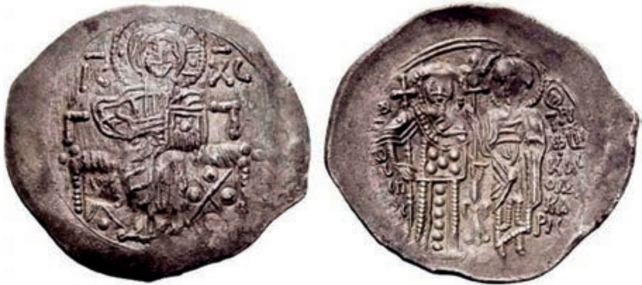
Сл. 2 Теодор II Ласкарис (1254–1258). Никејско царство, Магнезија – Аспрон трахеј номизма (1256/57).