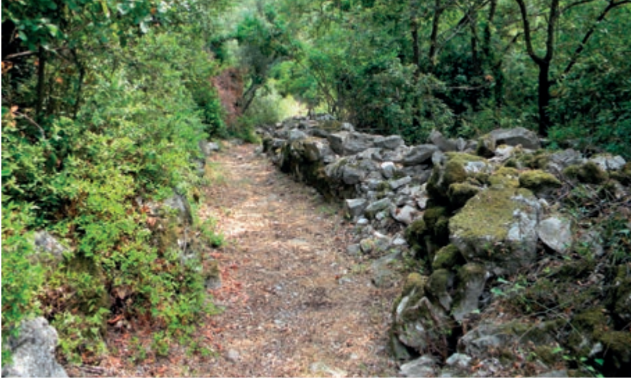
Слика 2 Шумска стаза са сухозидом југоисточно од врха Св. Луке