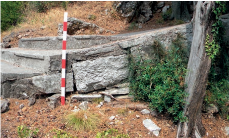
Слика 3 Квадер у супструкцији косе рампе