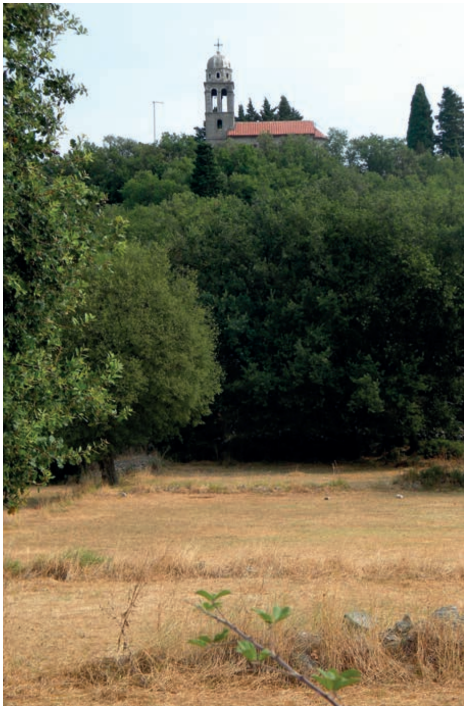
Слика 1 Св. Лука – поглед с југа (фотографисао М. Д.)