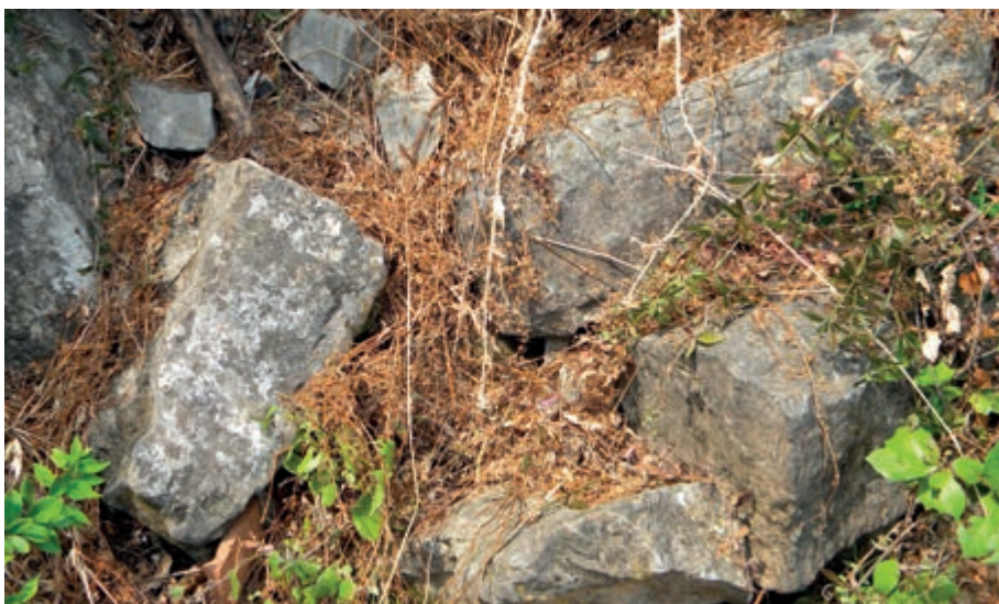
Слика 5 Обрушени блокови јужно од косе рампе, западно од асфалтног пута