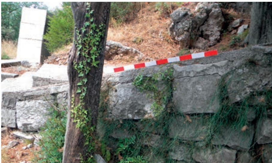
Слика 4 Квадери у супструкцији у секундарној употреби