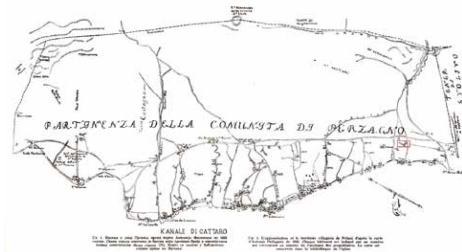
Slika 3. Karta Prčanja Antonija Filipinija iz 1802. godine preuzeta iz članka B. Kojića iz 1956. godine sa označenom pozicijom predmetne stambene cjeline