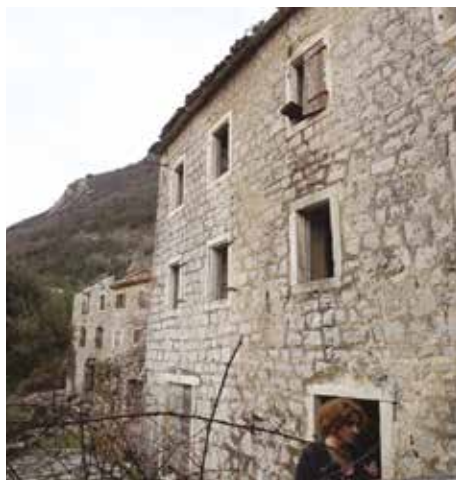
Fot. 1. Pogled sa sjeveroistoka na stambenu cjelinu sa južnom zgradom (lijevo) i sjevernom zgradom (desno)