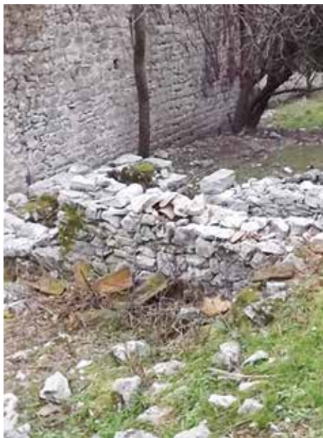
Fot. 7. Najmanji pomoćni objekat (štala) na gornjoj strani južne zgrade