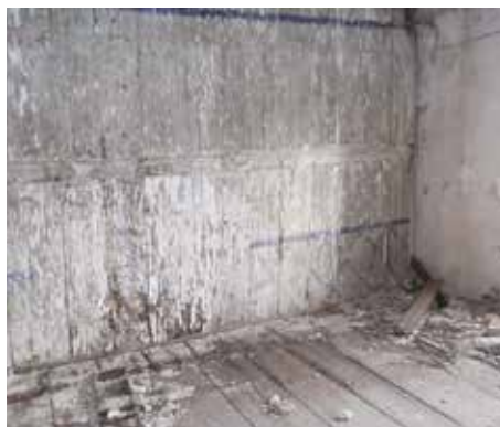
Fot. 20. Drvene pregrade između prostorija na I spratu dekorisane u donjoj zoni, jednostavnim geometrijskim motivima u plavoj boji