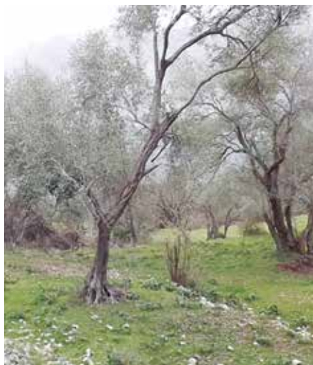
Fot. 18. Maslinjaci i terasasta obradiva imanja koja se pružaju istočno, prema moru