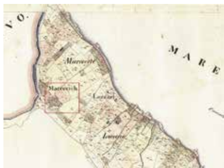
Slika 5. Položaj stambene cjeline u sjevernom dijelu naselja Prčanj, prikazan na austrijskom katastarskom planu iz 1838. g.

Kada se ima u vidu sve navedeno može se pretpostaviti da su “Cugini Macovich” zapravo Matkovići, te da je kartograf Filipini izostavio jedno slovo u imenu porodice po kojoj je cijeli potez dobio toponim Matković.