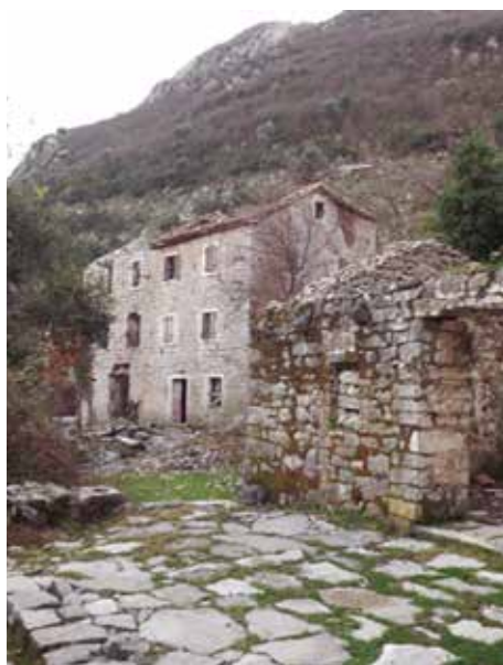
Fot. 3. Pogled na južnu zgradu (lijevo) i dvorište sjeverne zgrade sa ruševnim pomoćnim objektom