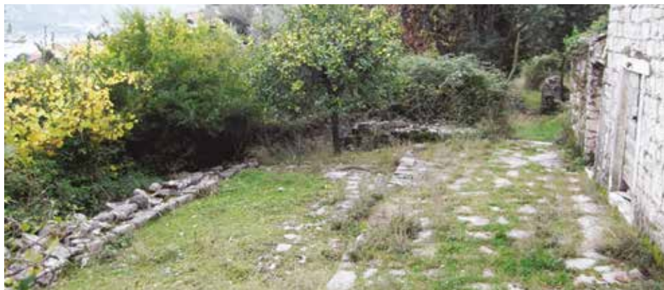
Fot. 16. Stablo limuna u južnom dijelu dvorišta ispred sjeverne stambene zgrade

U južnom dijelu dvorišta, ispred sjeverne stambene zgrade, nalazi se stablo limuna i uz sjevernu fasadu južne zgrade razgranati grm jasminka 4 , a čitav ansambl je uokviren lovorima i maslinama (Fot. br. 16, 17 i 18). Istočno i južno od opisane stambene cjeline, još uvijek se pružaju terasasta obradiva imanja sa maslinjacima i voćnjacima.