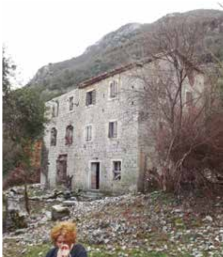
Fot. 17. Jasmin uz sjevernu fasadu južne zgrade