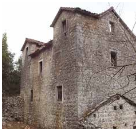
Fot. 11. Pogled sa jugozapada na sjevernu stambenu zgradu

Na osnovu zatečenih ostataka uređenja terena oko objekata, može se zaključiti da su dvorišta ispred obje stambene zgrade bila ograđena kamenim zidom debljine cca od 70 - 100 cm i popločana kamenim pločama nepravilnog oblika (Fot. br. 3, 4, 9 i 10). Obje stambene zgrade su pravougaone osnove i spratnosti P+2+Pk, zidane od priklesanog kamena u pravilnim horizontalnim redovima. Kuće su imale dvovodne krovove, pokrivene kanalicom sa ugaonim viđenicama orjentisanim prema brdu (Fot. 1, 2, 3, 4, 11 i 12).