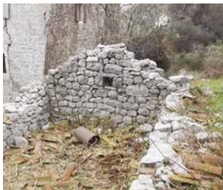
Fot. 6. Pomoćni objekat (štala) sjeverozapadno od južne zgrade