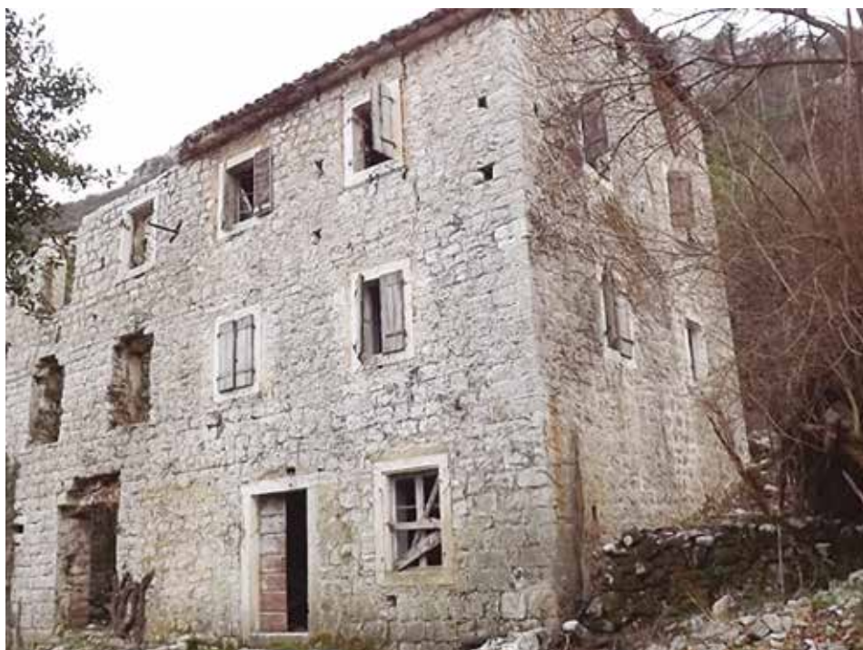
Fot. 13. Pogled sa sjeveroistoka na južnu zgradu

Sjeverna i južna stambena zgrada, razlikuju se još i po tome što je uz ju-goistočnu fasadu sjeverne zgrade, dozidan prizemni pomoćni objekat (Fot. br. 1, 2, 3, 4 i 13).