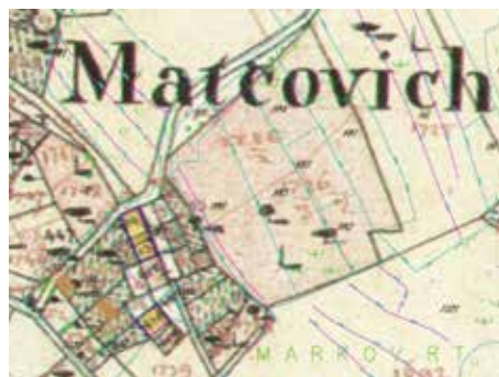
Slika 6. Preklop savremene katastarske podloge preko austrougarskog katastarskog plana iz 1838. godine