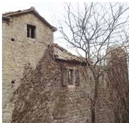
Fot. 12. Pogled na sjeverozapadni ugao južne stambene zgrade

Iako u ruševnom stanju, na fasadama i u unutrašnjosti obje stambene zgrade, mogu se očitati podaci na osnovu kojih se u potpunosti mogu sagledati njihove arhitektonske karakteristike. Iako se za sjevernu stambenu zgradu može reći da je