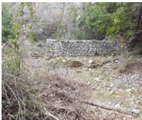
Fot. 5. Pomoćni objekat (štala) na zapadnoj strani sjeverne zgrade