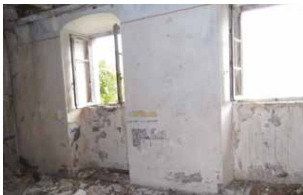
Fot. 21. Tragovi starijeg bojenog sloja sa geometrijskim podjelama u tamno sivoj i oker boji koji se naziru ispod podljudspanog poznijeg krečnog premaza na istočnom zidu prvog sprata