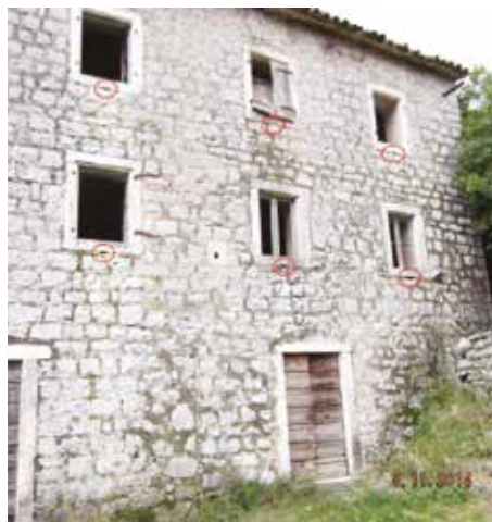
Fot. 2. Sjeverna stambena zgrada sa prilaznim stepeništem