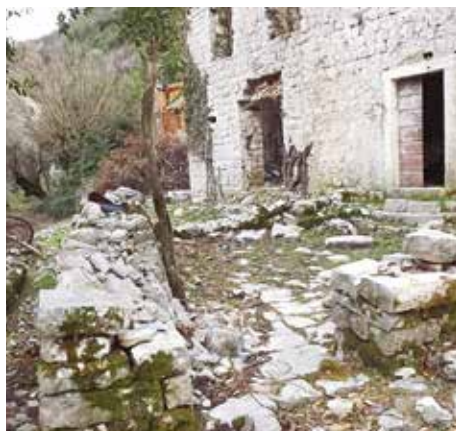
Fot. 9. Dvorište južne stambene zgrade