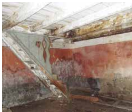
Fot. 19. Detalj očuvanog enterijera - drveno stepenište u prizemlju sa djelimično očuvanim ogradom i detalj međuspratne konstrukcije