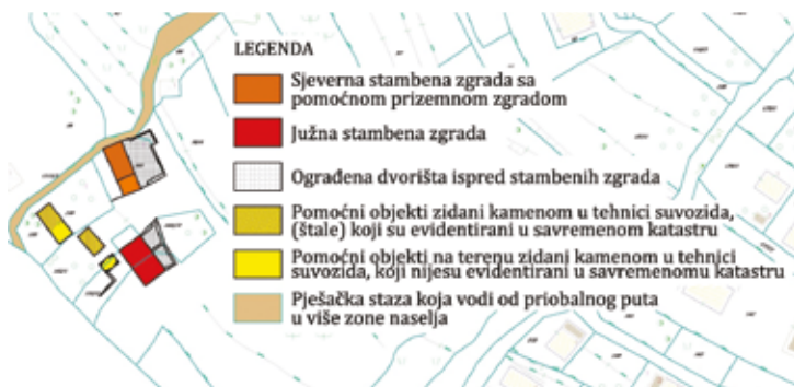
Slika 2. Dispozicije stambenih zgrada, dvorišta i pomoćnih objekata u okviru stambene grupacije