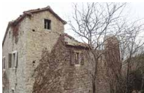
Fot. 15. Položaj južne puškarnice u visini prvog sprata glavne fasade sjeverne zgrade

Pomoćni prizemni objekat koji je dozidan u širini južne fasade sjeverne stambene zgrade u dužini od cca 4 m, zidan je u nešto lošijoj tehnici u odnosu na stambene zgrade. Ima otvor za vrata i zazidan prozor na istočnoj strani. Na južnoj strani, na kalkanskom zidu pomoćni objekat ima dva prozora koji nijesu u istoj osi, dvokrilni na kojem se još nalaze drvene grilje i manji iznad njega. Sudeći po kalkanskom zidu, krov pomoćnog objekta je bio dvovodan (Fot. br. 3 i 4). Na osnovu podataka sa terena i iz katastarske dokumentacije, ostali pomoćni objekti na okolnom terenu sagrađeni su kasnije, od kamena su i građeni u tehnici suvozida, a nalaze se u najlošijem stanju. Osim na srednjem, nema pouzdanih podataka o njihovim visinama i krovovima (Fot. br. 5, 6 i 7).