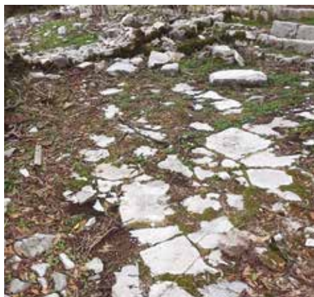
Fot. 10. Ostaci popločanja dvorišta južne stambene zgrade (detalj)

Na osnovu zatečenih ostataka uređenja terena oko objekata, može se zaključiti da su dvorišta ispred obje stambene zgrade bila ograđena kamenim zidom debljine cca od 70 - 100 cm i popločana kamenim pločama nepravilnog oblika (Fot. br. 3, 4, 9 i 10). Obje stambene zgrade su pravougaone osnove i spratnosti P+2+Pk, zidane od priklesanog kamena u pravilnim horizontalnim redovima. Kuće su imale dvovodne krovove, pokrivene kanalicom sa ugaonim viđenicama orjentisanim prema brdu (Fot. 1, 2, 3, 4, 11 i 12).