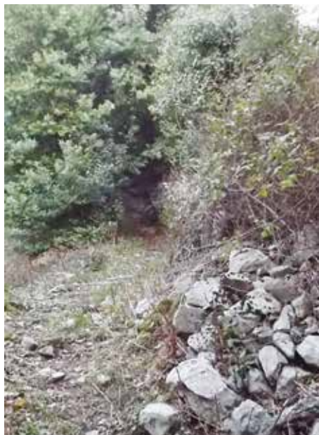
Fot. 8. Pješačka staza (detalj), koja vodi od priobalnog puta u više zone naselja, sjeverno od kompleksa

Prilaz kompleksu sa sjeverne strane je od pješačke staze, koja vodi od priobalnog puta u gornje zone naselja (Fot. br. 8). Od ove staze ka denivelisanom dvorištu sjeverne zgrade spušta se kameno stepenište, a dalje preko popločanog dvorišta dolazi se i do dvorišta južne stambene zgrade (Fot. br. 2, 3, 4, 9 i 10). Sa južne strane, prilaz ovoj stambenoj cjelini moguć je od postojećeg kolskog puta, koji je formiran na trasi starog pješačkog puta.