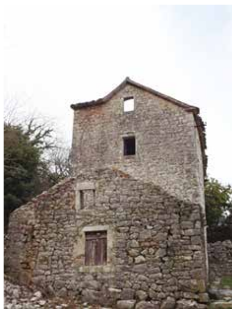
Fot. 4. Pogled sa juga na sjevernu stambenu zgradu sa dvorištem i pomoćnim objektom

Zapadno od stambenih zgrada, na strani prema brdu, uklopljeni u padinu terena, u tehnicu suvozida izgrađena su tri pomoćna prizemna objekta, koji su danas u ruševnom stanju i bez krovova. (Fot. 5, 6 i 7).