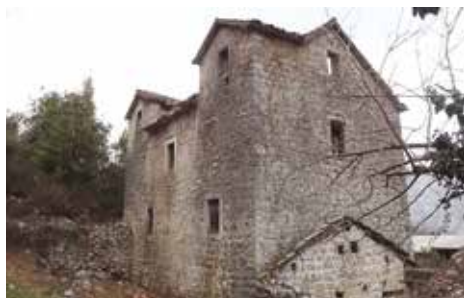
Fot. 14. Otvori za odvod vode ispod podprozornika prozora na sjevernoj fasadi južne zgrade