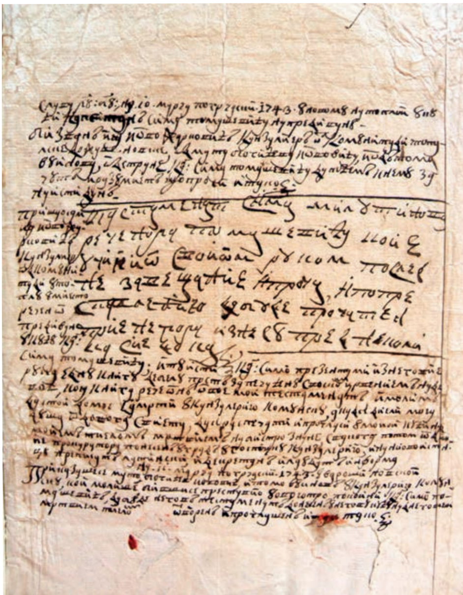
Слика 1. Опорука Сима Милутиновог, прва страна