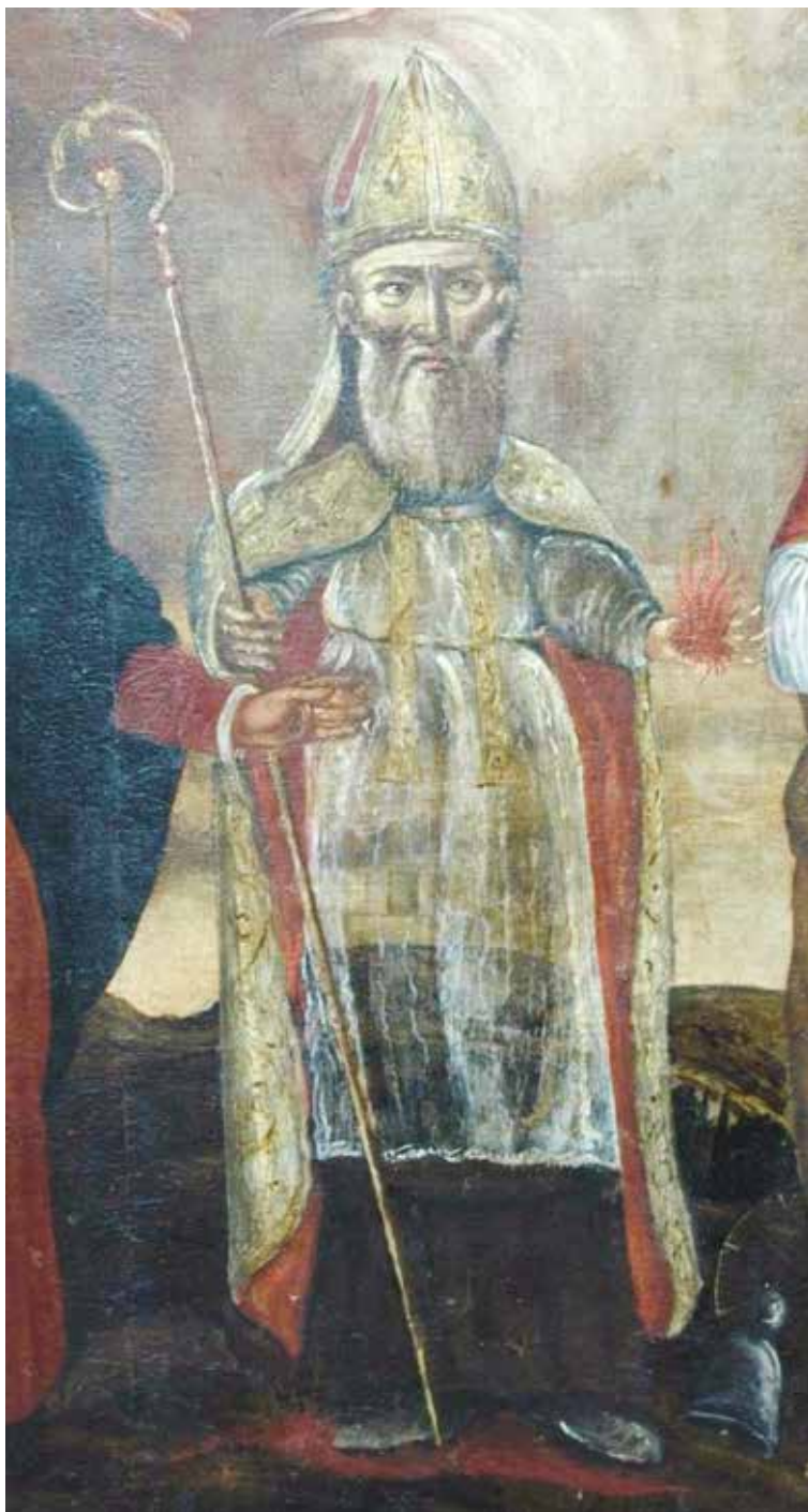
Slika 5. Sv. Antun opat na slici na platnu