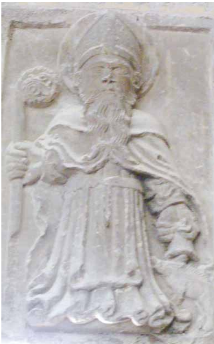
Slika 4. Sv. Antun opat na kamenom reljefu

pri Crkvi Sv. Pavla prestao je da postoji između 1807. i 1814. 52 godine. Time ova predstava, nastala na samom početku XIX vijeka, njegovim primjerom podsjeća na istinske poruke hrišćanske vjere i poziva one kojima je vjera potrebna, a Sv. Antun dobija status opšteg zaštitnika što mu izvorno i pripada.