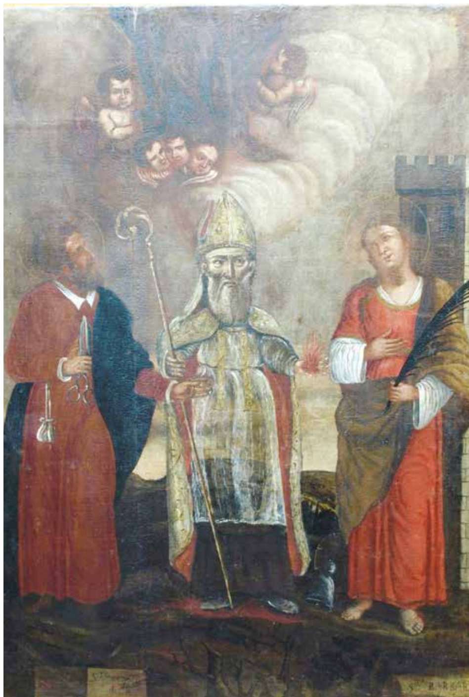
Slika 3. Sv. Homobon, Sv. Barbara i Sv. Antun opat