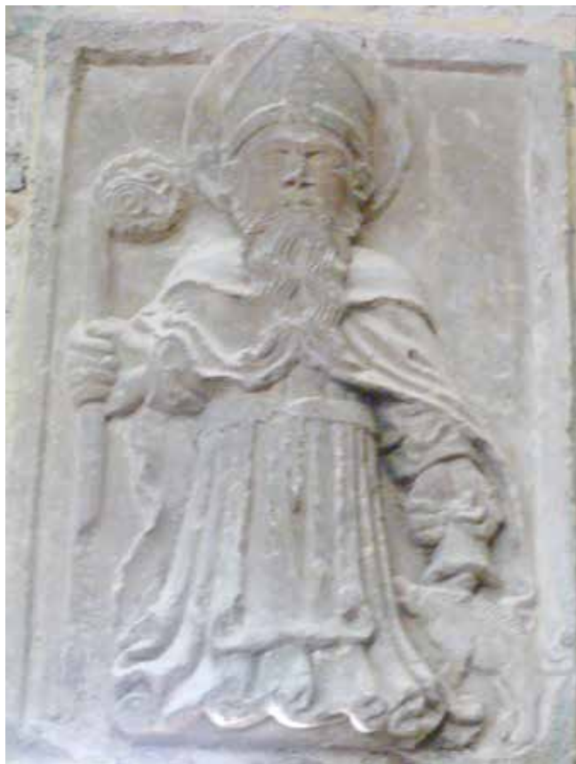
Slika 2. Sv. Antun opat, reljef u kamenu