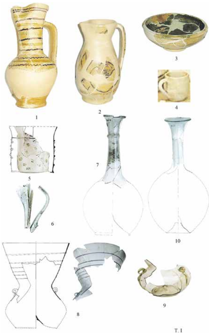
1-4: Прото мајолика; 5: чаша са ситним аплицираним капима; 6: изливници; 7, 10: боце са и без проширења на левкастом издуженом врату; 8, 9: биконично велико и мало кандило