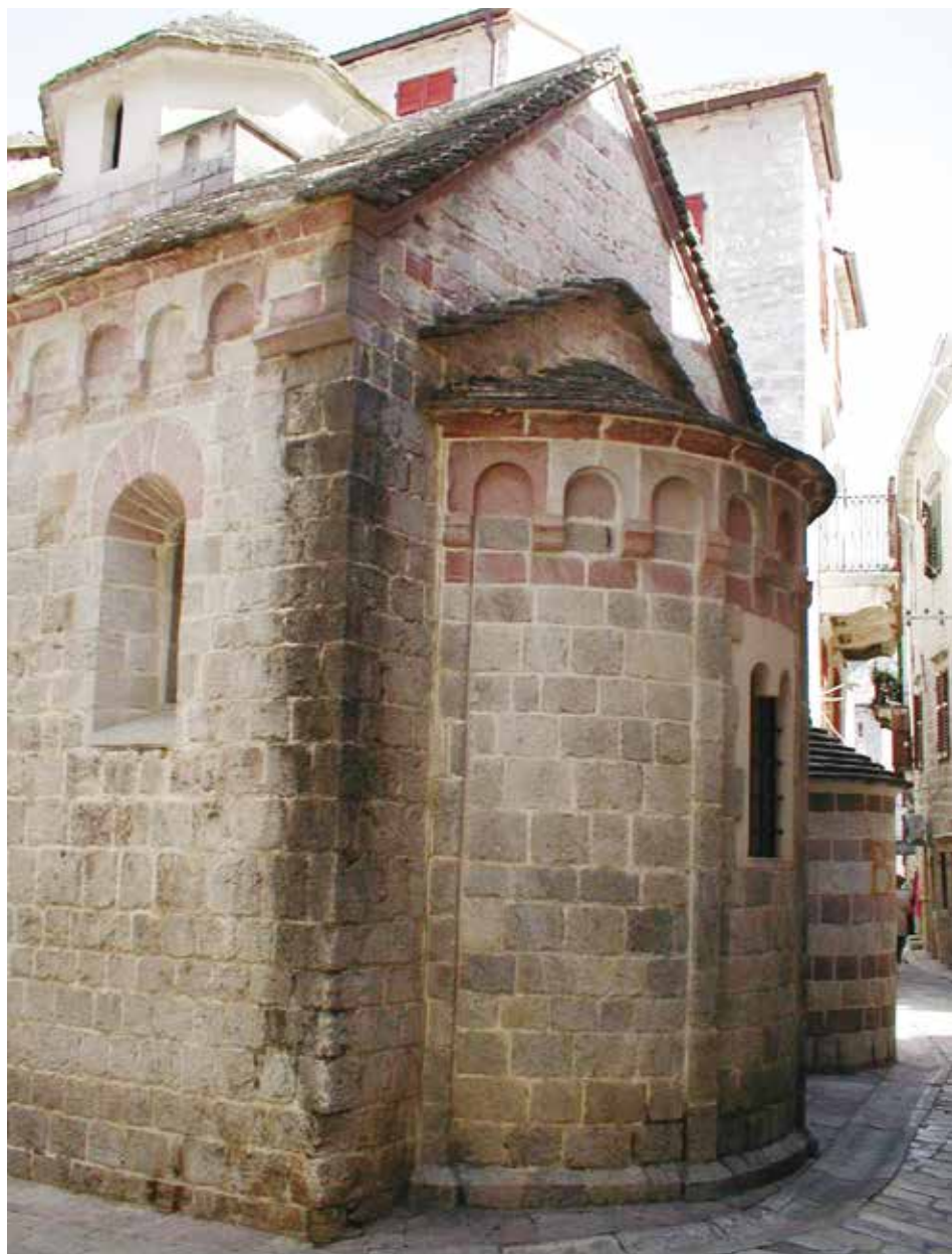
Сл. 4. Црква Св. Ане