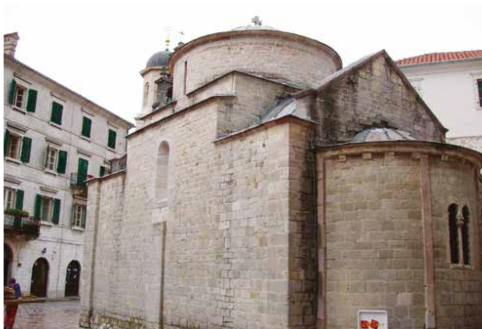
Сл. 2. Црква Св. Луке, после радова