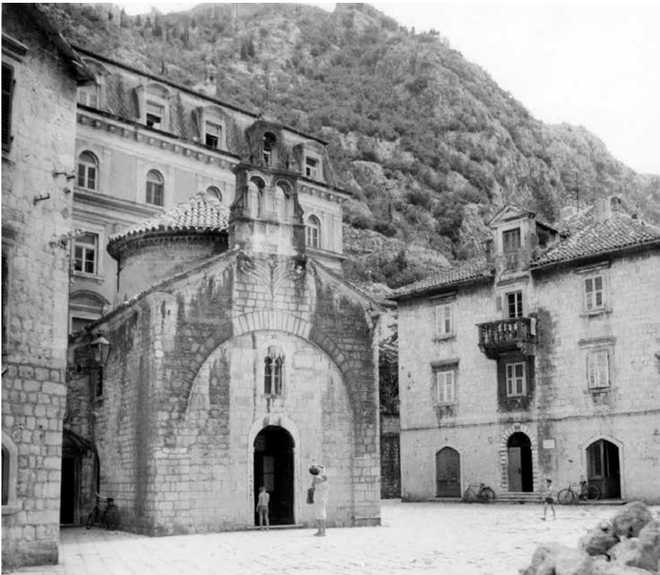
Сл. 1. Црква Св. Луке, пре радова

И данас, више деценија после примене, тај покривач врло добро заштити унутрашњост цркве.