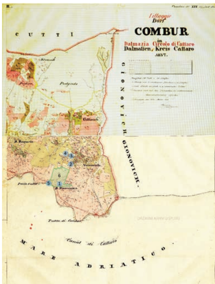
Sl. 2 Plan Kumbora iz 1837. g. sa označenim građevinama (br. 1-5) i zemljišnim posjedima (br. 6) vlasnika Antonija Bujovića 1 - Crkva k.p.104; 2 - Mlin k.p. 105; 3 - Kućak.p. 106; 4 - Štala k.p. 107; 5 – Ruševina k.p. 102.

Исправка садржи 5 илустрација које припадају раду ПОСЈЕД ВИЦКА БУЈОВИЋА У КУМБОРУ, аутора Зорице Чубровић, објављеном у Бока: зборник радова из науке, културе и умјетности , Херцег Нови, бр. 39/2019, стр, 91-93, 95.