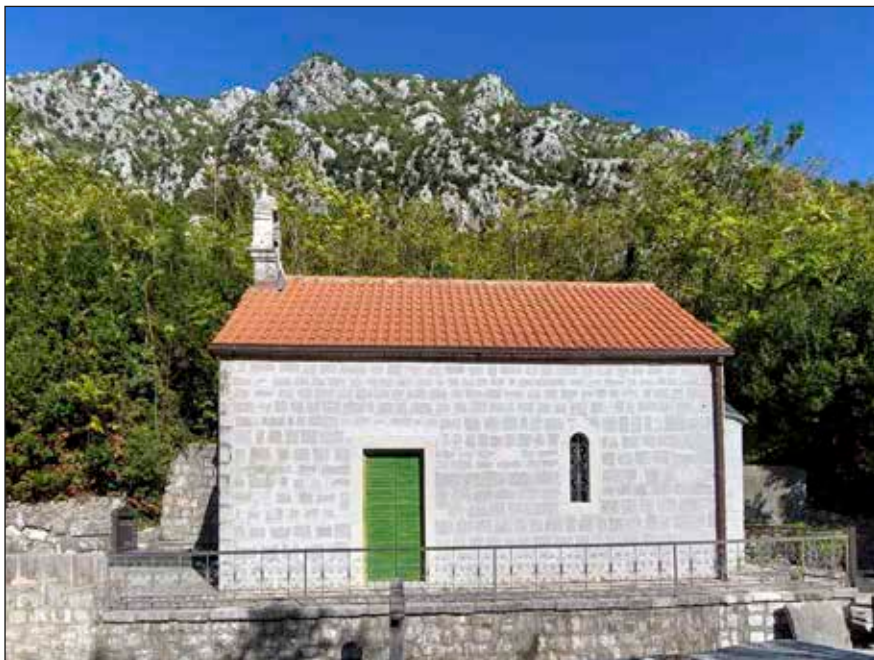
Сл. 2а | Црква Светог Јована Богослова на Сврчку

престоне иконе Христа и Богородице, Царске двери, као и дио икона са оригиналног иконостаса, рад иконописачке радионице Димитријевић–Рафаиловић. На Царским дверима уписана је 1786. година.