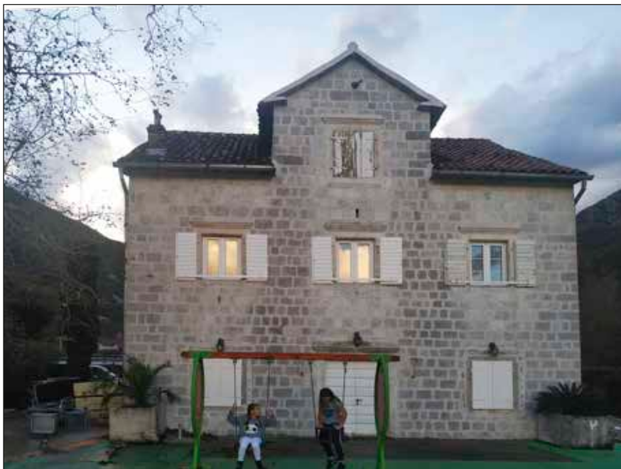
Сл. 1 | Данашњи изглед морињске школе

Од 1870. године, школа се налази у каменој кући на самој обали мора. Масивна, јака, камена кућа, на самој обали, као да извире из мора и тако пркоси бури, југу, неверама и земљотресима, бомбама и громовима. Чини се као да опстаје само са једним задатком, давно записаним: „Да се дјеца ту вазда буду учити!“ Као да су ове ријечи уклесане у сваком камену, који уз шум таласа непрестано понавља ове ријечи. Ове ријечи, написао је давне 1864.