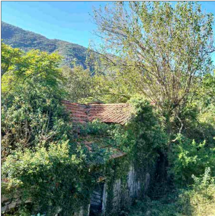
Сл. 7 | Тренутно стање Крилове куће на Сврчку

поправљени су прозори и шкура, те су ђаци ове школске 2023/24. године, могли да уђу у суву и окречену учионицу, захваљујући сарадњи МЗ Морињ и руководству О. Ш. „Вељко Дробњаковић“. 61