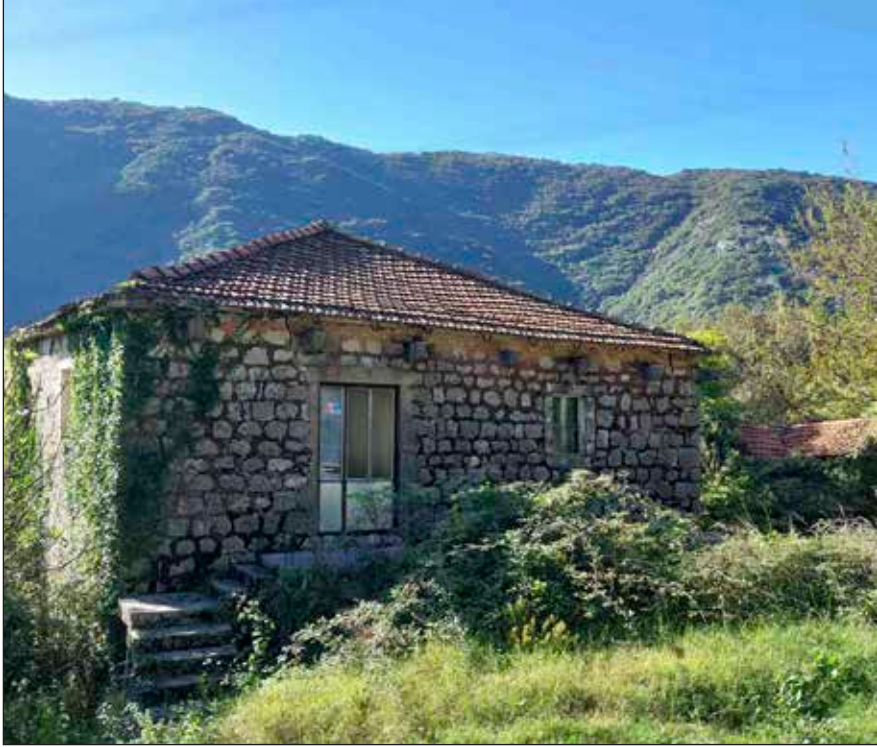
Сл. 3 | Кућа Матковића у којој је 1803. године отворена школа. До ње се налази Крилова кућа на Сврчку.

ца је радила све до Другог свјетског рата, када је спаљена. Неке сачуване вриједности, предате су Музеју у Херцег Новом, након ослобођења Мориња. Сјећање на ову библиотеку није замрло у сјећањима становника Мориња. Требало је времена да се Морињ опорави од страха и људских жртава након Другог свјетског рата. Приликом обиљежавања сто деведесет година од постојања морињске школе, поново је обновљена Крилова читаоница, која је смјештена у просторијама данашње школе, у знатно мањем простору, него у Крилово вријеме. Отварајући обновљену библиотеку, тадашња директорица О. Ш. „Вељко Дробњаковић“ у Рисну 39 ,