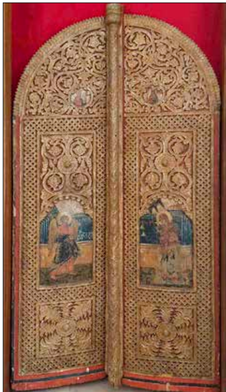
Сл. 26 | Царске двери у цркви Светог Јована Богослова на Сврчку

Криле никада за себе није што тако рекао, већ се поносио својим трговачким занатом. О његовом добром материјалном стању, свједочи нам како његов тестамент, тако и његов портрет, начињен током живота, на коме се јасно види прстен на Криловој руци, што је био показатељ завидног материјалног стања тога доба.