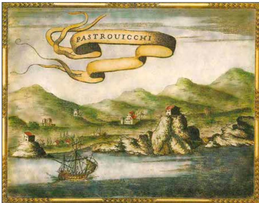
Сл. 1 | П. Коронели, Паштровићи

графичар замијенио острво Катич и острво Св. Никола у Будви. Већ на другој карти из 1838. године, Вељи Катич се именује са Катич, а мали Катич са Св. Неђеља. 5 Овај приказ нам недвосмислено потврђује да је црква 1838. године постојала на Малом Катичу.