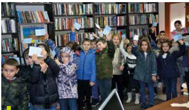
Новски малишани први пут у Библиотеци.