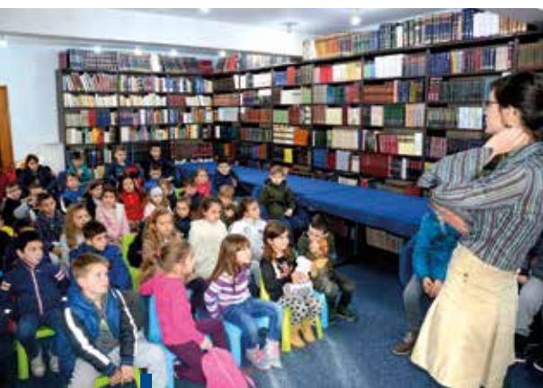
Програми за дјецу у Библиотеци.