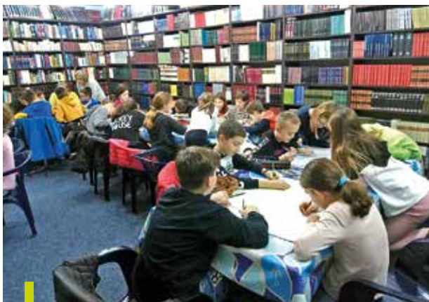
Програми за дјецу у Библиотеци.

У ишчекивању стабилизовања епидемиолошке ситуације интензивно смо припремали програм 18. МСК Трг од књиге 2020 . током априла и маја, са прелиминарним уговарањем учесника из Црне Горе, окружења и иностранства. Како није дошло до значајнијег побољшања услова, напротив биле су извјесне финансијске посљедице епидемије, а услиједила је и забрана уласка у Црну Гору, били смо принуђени да одустанемо од изворног концепта Сајма, то јест гостовања бројних издавача са актуелном продукцијом, писаца, преводилаца, књижевних критичара, глумаца... и драстично редукујемо програм, који представља минимум, односно само покушај